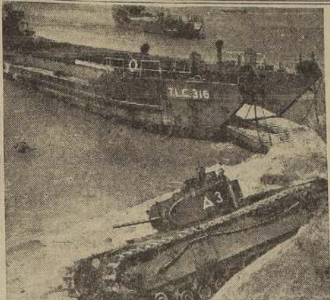
Recién desembarcado, este tanque "Churchill" se lanza a toda velocidad por la costa al encuentro del enemigo. Los tanques "Churchill" están tan formidablemente blindados que pueden emplearse como un fortín. Poseen, sin embargo, una gran velocidad y sus cañones de 6 libras les dan un magnífico poder destructor.

NUEVA YORK, 15. — (U. P.). Un corresponsal naval del servicio de informaciones británicas anunció que hasta el 1.º de noviembre del año pasado, Rusia recibió por mar de Gran Bretaña, 3.000 aviones, 4.000 tanques, 30.000 toneladas de municiones, 800.000 toneladas de alimentos, 300.000 toneladas de municiones, 300.000 toneladas de abastecimientos médicos. Añadió que las ventajas a largo plazo obtenidas por Rusia, compensan ampliamente las pérdidas sufridas por los convoyes.