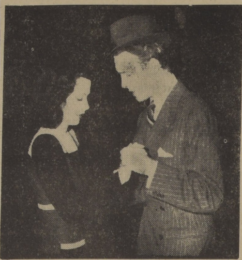
Entre escenas y escenas de esta nueva película de la Metro-Goldwyn-Mayer, James Stewart dirige la acción de Hedy Lamarr.

En sus funciones de mañana, el Teatro Metro estrenará en matinee, vermouth y noche, la nueva y graciosa comedia Metro-Goldwyn-Mayer, titulada "La Cuesta del Olvido". Esta obra, bajo la dirección artística de Clarence Brown, es un modelo de vaudeville, chispeante de gracia, de juventud y de belleza. Dos grandes figuras de la pantalla, James Stewart y Hedy Lamarr, llevan los roles principales con acierto.