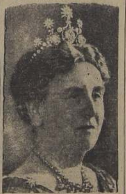
S. M. la Reina de Holanda.

LONDRES, 30 (U. P.) — La Reina Guillermina de Holanda, en una radiodifusión para el Imperio, declaró que si las Indias Holandesas son atacadas, "estamos completamente decididos a luchar". Dijo: "No puede haber dudas de que si las circunstancias originadas por la situación geográfica de las Indias, hacen necesaria la resistencia, aceptaremos la batalla en solidaridad con nuestros aliados". Urgió a sus súbditos de Holanda a continuar la resistencia pasiva, expresando su satisfacción por el éxito de la