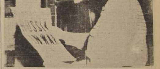
MANILA.— El general Douglas Mac Arthur, comandante en jefe de las fuerzas aliadas en el Pacífico, lee la noticia de la entrada rusa en la guerra contra el Japón.