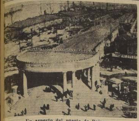
Un aspecto del puerto de Dairen