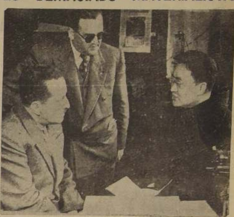
El Padre Kao, durante su visita a LA NACION

—En Occidente hay muchas maravillas que admirar en cuanto a obras materiales. Pero el mundo occidental ha descuidado el punto de vista espiritual. Hay demasiado materialismo. Me parece que los hombres de este hemisferio, deben poner más atención a las manifestaciones del alma que son las más bellas de la vida. Por el excesivo materialismo vienen los conflictos entre los hombres, y en seguida, las guerras, con su cortejo de dolores y calamidades. Si debemos cuidar y perfeccionar nuestras cualidades espirituales, como seres dignos de mayor perfección.