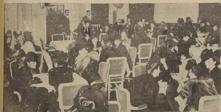
Aspecto parcial de uno de los salones del Hotel Carrera a la hora del servicio del té