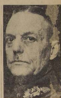
Grav. Von Rundstedt, jefe militar alemán en la Francia invadida

Simultáneamente con el desembarco, las unidades navales mantuvieron un sostenido ataque contra las posiciones costeras de la zona, al mismo tiempo que las formaciones de bombarderos pesados y medianos y cazas de la Real Fuerza Aérea, y norteamericanos devastaban en ataques demorales las vías de comunicación abastecimiento y socorro, de tierra, mar y aire de los alemanes, impidiendo