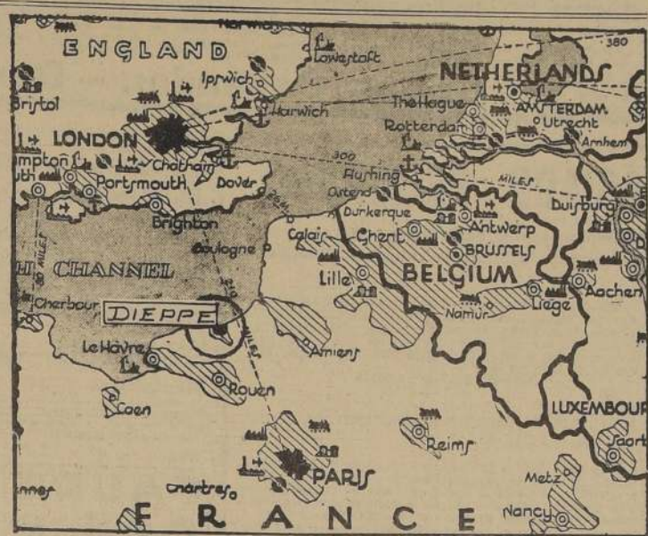
Mapa de Francia, en el que se destaca la posición del puerto de Dieppe, escenario de la mayor operación realizada por los "commandos" ingleses, con cooperación de fuerzas norteamericanas y canadienses.

WASHINGTON, 19 (U. P.). — "Washington Star" dice en su editorial que la tensión guerrera aproxima más que antes a Brasil y Estados Unidos. "Los sucesos que han llevado a Brasil al borde de la guerra tuvieron el efecto de reforzar la tradicional amistad de ambas naciones. Sugiere que "la historia en 1942 se repite la obra de 1917."