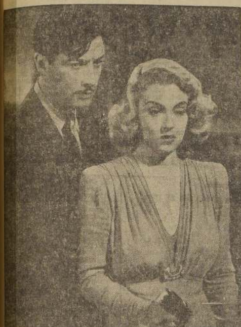
Robert Taylor y Lana Turner, encabezan la plana mayor de grandes artistas de la pantalla, que actúan en este nuevo film de Metro-Goldwyn-Mayer.

El Teatro Metro, cada semana confirmando su ofrecimiento que hiciera a comienzos del presente año: mantener y aumentar la calidad de sus espectáculos dramáticos, a pesar de las circunstancias actuales. Los títulos de "El amor no muere", "La mujer del año", "El gallardo vencedor", "De mujer a mujer", "La sombra de los acusados", "El teatro de Tarzán", "De corazón a corazón", "Otra vez más", "De la obscuridad", "Cumbres de pasión", "El soldado de chocolate", "Música y Juventud", son una prueba de ello. De pues, luego de recibir como una de las más grandes producciones del cine, la obra prohibida, desde el momento en que la dirección del Metro la sanciona bajo esa clasificación.