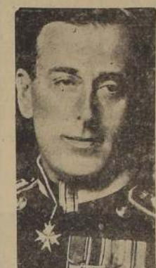
Lord Louis Mountbatten, jefe de los "Commandos" ingleses.