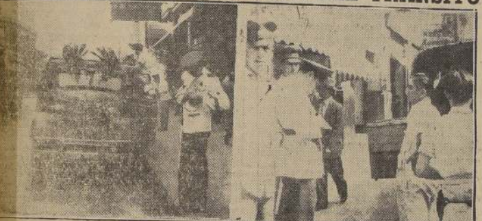
Guarderías hacen cumplir la orden que prohíbe el estacionamiento de vehículos en calle Bandera.

Personal de la Prefectura de Carabineros del Tránsito y de la Policía Municipal de la provincia de Santiago, han estado cumpliendo estricto cumplimiento a las disposiciones puestas en vigor.