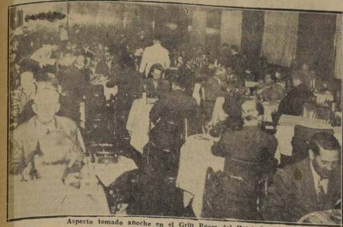
Aspecto tomado anoche en el Grill Room del Hotel Carrera