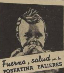
Fuerza, salud y belleza FOSFATINA FALIERES