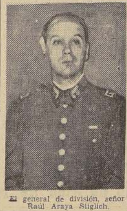
El general de división, señor Raúl Araya Stiglich.