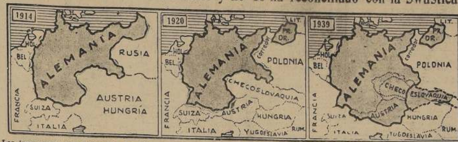
Los tres mapas que anteceden describen la evolución territorial alemana, desde la época del Imperio hasta hoy, con las pérdidas que sufrió el Reich a consecuencia del Tratado de Versalles, y las adquisiciones recientes, derivadas de la acción del señor Hitler en la Europa Central. La República Eslovaca, que aparece grisada en el tercer mapa, si bien goza de independencia en este momento, se halla bajo la protección directa y la influencia de Berlín.

Praga, 16 (U. P.). — Los alemanes en Praga una bofetada de unos 3,500 millones de coronas en fondos de los libros del Reich.