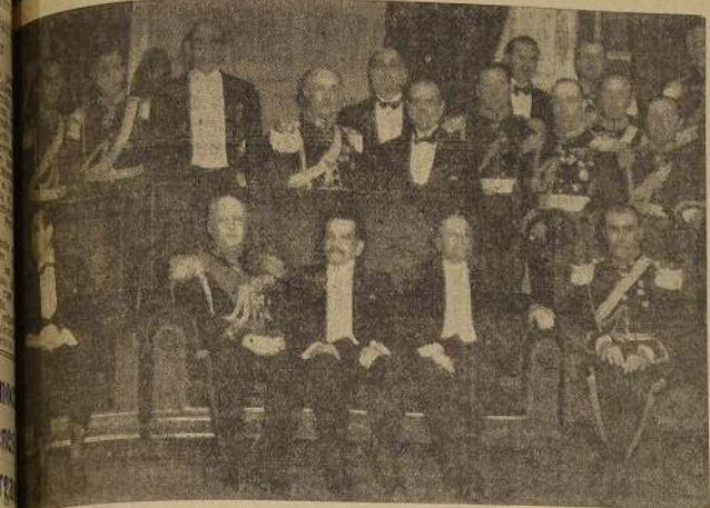
Presidente de la República, acompañado de los Ministros de Defensa Nacional, Relaciones, del Comandante en Jefe del Ejército y de altos jefes de las Fuerzas Armadas.