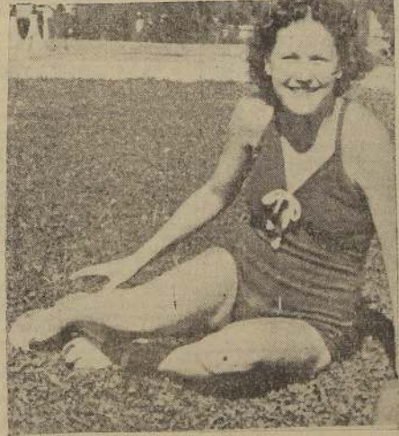
Instantáneas tomadas a la hora del baño en la piscina del Club de Golf de Los Leones, donde se reúnen numerosas señoras y damas de nuestra sociedad.