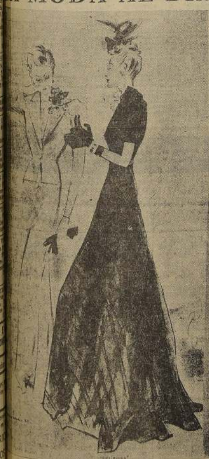
Este talleur modelo de Anny Blatt de París, para la noche en jersey de seda natural, blanco, sobre el cual un paño de flores en "paillete" pone una nota brillante. La noche en el negro, y jabot de encaje. Botones en oro y rubí.