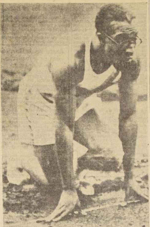
Eddie Tolán, de Detroit, que en la selección olímpica de Estados Unidos igualó el récord mundial de los 100 metros, con 10.410".

DE MAYO F. C.—Directorio para mañana, a las 21, en Delicias 424. LIBERTAD F. C.—Junta general hoy, a las 20, en el local de costumbre. DEPORTIVO LA PRENSA.—Junta general hoy, a las 19, en el local de costumbre.