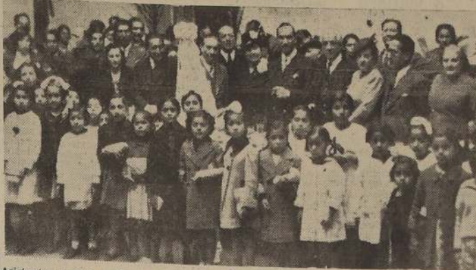
Asistentes al acto en honor de la esposa de S. E. en el Club Independencia de la Defensa de la Raza.

Con brillo se dio comienzo ayer a las festividades en celebración de la "Semana del Niño", organizada bajo los auspicios del Rotary Club y la institución de Defensa de la Raza y el Progreso de las Horas Libres. El día de ayer estuvo dedicado a "La Madre", y el programa que se había confeccionado para tal efecto fue cumplido en