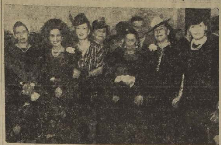
Algunas damas asistentes al cocktail con que el Consejo Nacional de Mujeres de Chile celebró el primer aniversario del Centro Femenino, institución que realiza una entusiasta labor en pro del mejoramiento cultural y económico de la mujer. Esta simpática reunión se efectuó en el Restaurante Femenino del Centro y congregó una numerosa y selecta concurrencia.