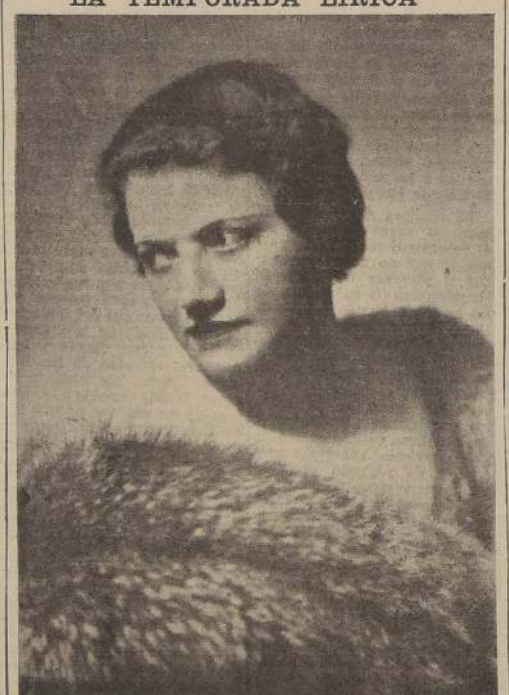
ROSE PAULYS la gran soprano, trífadora en los escenarios de Alemania, Austria, Italia y América, que tendrá a su cargo el papel de "Brunilda" en la representación de "WALKIRIA" que subirá a escena en el Teatro Municipal el viernes 15, en la penúltima función de abono. Rose Paulys obtuvo un éxito clamoroso en el Colón de Buenos Aires interpretando "Electra" de Strauss, bajo la dirección del maestro Kleiber.