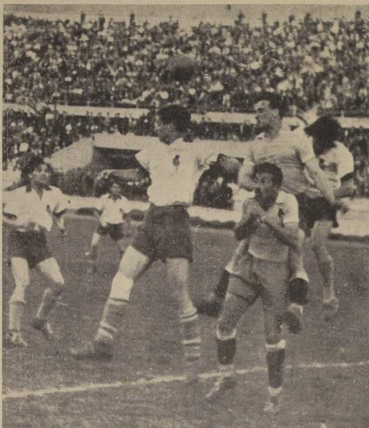
EN EL CAMPO URUGUAYO.— La defensa de los orientales se defende con mucha dificultad ante un ataque de los universitarios chilenos