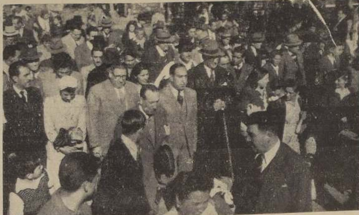
Parte de la numerosa concurrencia que asistió ayer a la colocación de la primera piedra de la Cooperativa de Huertos Obreros "José Maza"