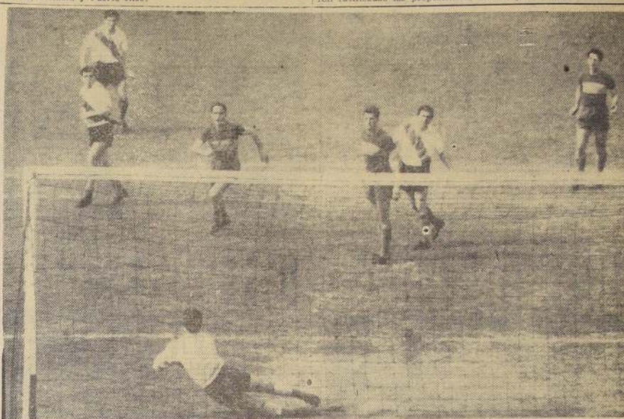
NO PASO NADA — Ni en la jugada ni en el partido, que terminó empatado a 2. River Plate y Boca Juniors, los rivales de siempre, no se hicieron nada. Los campeones siguen rezagados.

ocupando el 6.º puesto, con 15 puntos. Los boqueses comp- taron 16 puntos, y son 5.ºs. En el grabado, el meta de Bo- Giambrotolomi, ataja un tiro expedido por el "veterano". Luchaba en medio de la ansiedad de los raqueros.