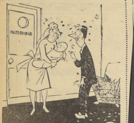
—Este... ¿se fijó si debajo del brazo tiene el pan?

Exquisito broche en forma de mariposa, creación del famoso diseñador francés Jean Schlumberger, vicepresidente de Tiffany & Company, Nueva York. Enjoyada con brillantes "pavé", la mariposa tiene dos magníficas esmeraldas en forma de pera engastadas en las alas superiores y las alas inferiores cuajadas de zafiros. Las piedras preciosas van engarzadas en platino y oro. Precio de esta joya, que es una magnífica obra de arte, 13.650 dólares, o sea, aproximadamente, 14.168.700 pesos chilenos.