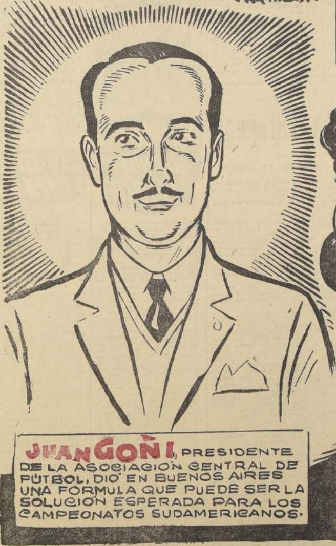
JUAN GOÑI , PRESIDENTE DE LA ASOCIACIÓN CENTRAL DE FÚTBOL, DIÓ EN BUENOS AIRES UNA FORMULA QUE PUEDE SER LA SOLUCIÓN ESPERADA PARA LOS CAMPEONATOS SUDAMERICANOS.