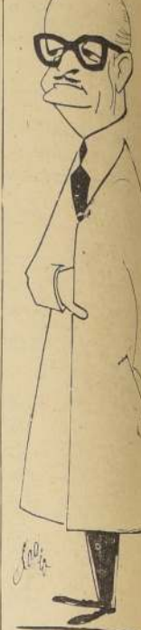
Ramon Villeda Morales, ex-Gobernador de Guatemala, fue el primero de una serie de funcionarios en Nicaragua.