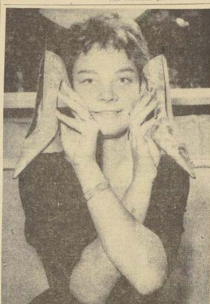
CALZADO FEMENINO PARA 1959.— Vemos aquí dos estupendos modelos lanzados por los modistos parisienses. Son la nota más elegante de escarpines derivados de la línea "Mandoline". A la izquierda, escarpin puntado en falda verde, punta y talón de raso blanco, con adornos de mostrilla; a la derecha, zapato de noche, puntado, en raso estampado azul y blanco, adornado de una flecha de mostrilla.