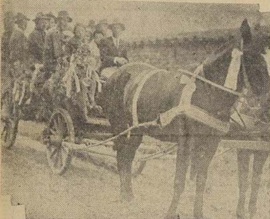
Un carro típico, adornado con banderas bávaras, en el que miembros de la colonia se dirigieron a la ceremonia

De acuerdo con las costumbres, a la entrada del pueblo, los novios y gran parte de la comitiva, debieron seguir a pie hasta la iglesia.