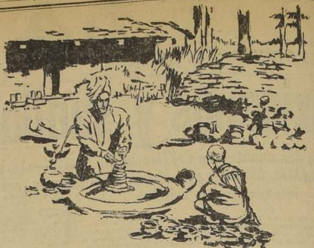
ALFABETO DEL HIMALAYA Dibujo de una fotografía Kodak tomada en la India

de lana doble ancho, colores de moda, calidad extra, el metro a $ 11.90 Primer Piso