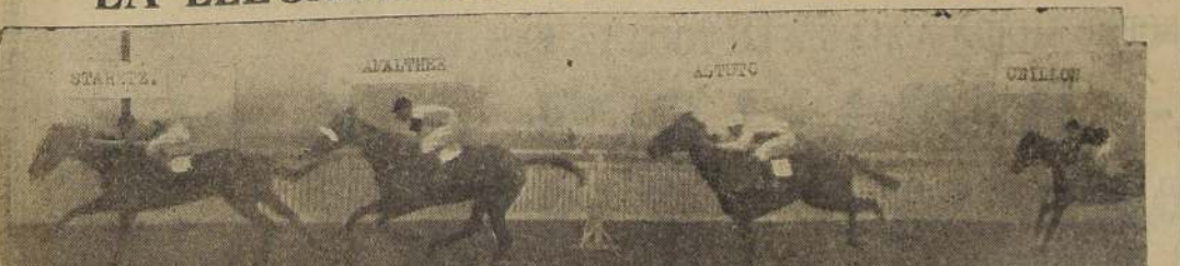
STARETZ (A. Gutiérrez, bate a Amalthée, Astuto y Crillon.