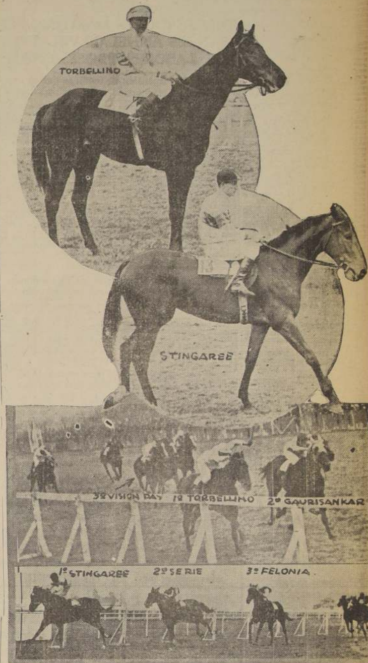
1.ª TORBELLINO 2.ª STINGAREE 3.ª FELONIA

Titulo retorcido, par... $ 2.30 De seda $ 3 y... $ 3.50 Hilo super-retorcido... 4.50 Hilo retorcido... 5.00 Sport de hilo retorcido... 3.50 10 años... 1.50 Venta... 1.50 FABRICA BELLA VISTA 0503 Final de los carros 9