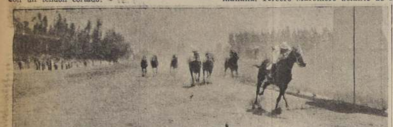
Sandial, al galope en la séptima. Lo escolta a 4 cuerpos Trago Amargo, y Hero.