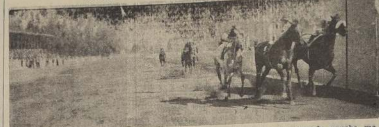
Padutina, se impone por pescuezo sobre Camarera y Aderezo en la segunda prueba matutina.