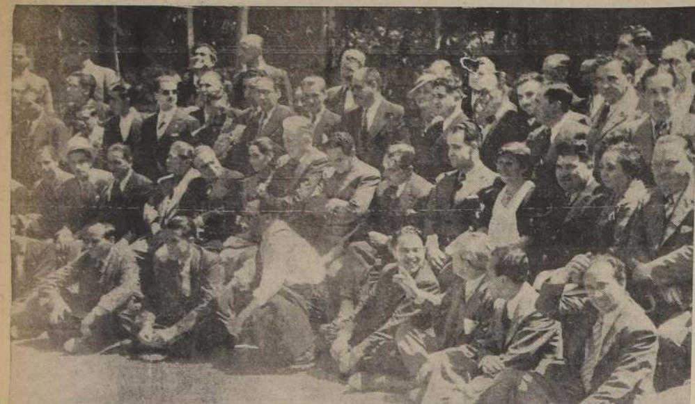
Parte de los asistentes al almuerzo ofrecido en Apoquindo a los concurrentes a la Convención de Periodistas

Para esto designó una comisión permanente formada por periodistas y representantes de los personales técnicos. — Muy lucido resultó el almuerzo ofrecido en Apoquindo por la Cía. Chilena de Electricidad