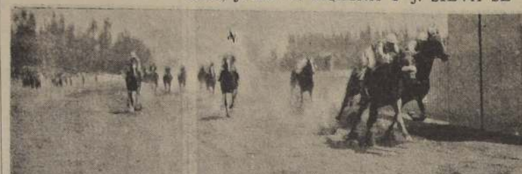
Bayanar, bate por 12 cabezas a Felonia. Tercero Amparo y cuarto Becassine.

Tercera Natascha a 3/4 de cuerpo y cuarta Helena; 5.a Rhoelina; 6.a Rosella; 7.a Padutina y última Pílica que fue alcanzada en una pata durante el curso de la carrera, resultando con un tendón cortado.