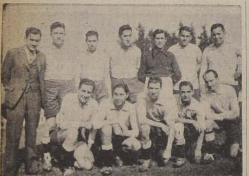
Equipo del Banco de Chile, ganador de la competencia de la Asociación Deportiva Bancaria.

EL PARTIDO Los rivales se jugaron por en-