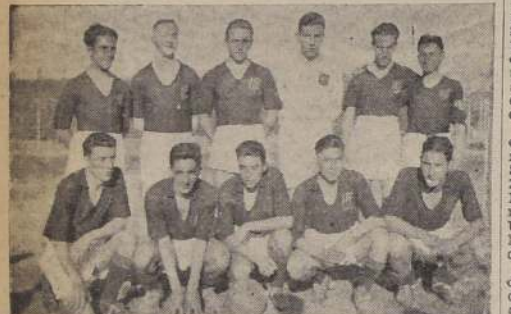
El "once" de la cuarta especial de la Unión Española, triple campeón de Santiago en los torneos de apertura, oficial y clausura. Jack Dempsey, el campeón que hizo la fama de su manager Jack Kearns