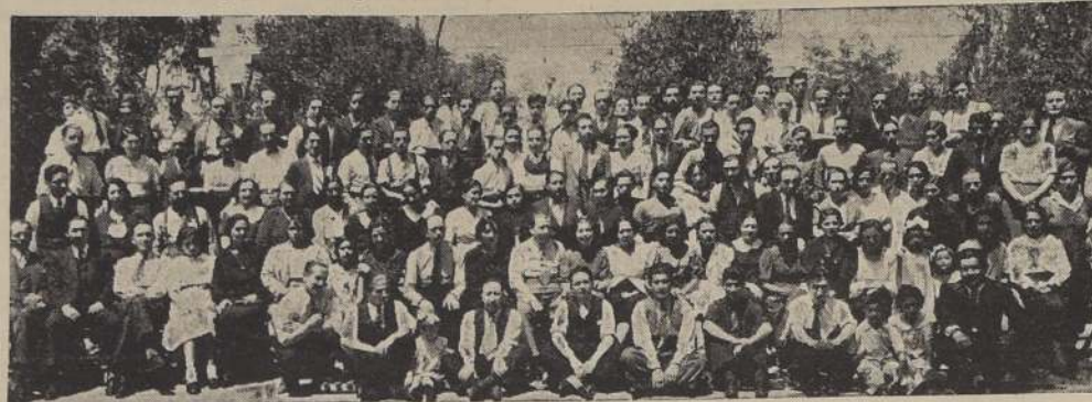
Socios y familias del Sindicato Industrial Imprenta y Litografía Universo que participaron en la tarde de ayer en las festividades conmemorativas del octavo aniversario de la corporación.

Trescientos asociados participaron en los actos conmemorativos. El almuerzo de ayer en la Quinta Los Naranjos alcanzó simpáticos caracteres. Oradores y delegaciones concurrentes. El Directorio y Comisiones del Sindicato fueron muy aplaudidos por el éxito de las fiestas aniversarias.