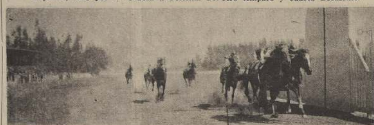
Temuco y Pretty Polly, cruzan la raya en perfecto empate en la cuarta carrera de la mañana. Tercero Maromero delante de Percalina.