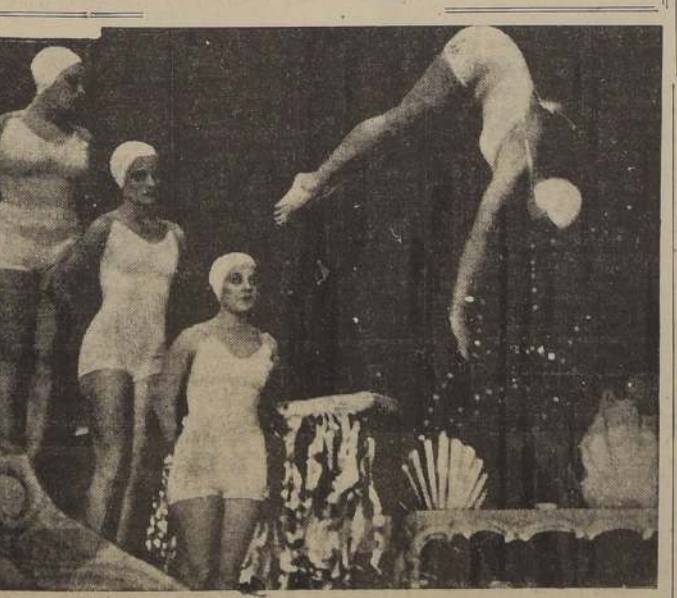
Fotografía tomada durante el desarrollo del original y moderno Ballet de Venus, que constituye en estos momentos uno de los mayores éxitos teatrales de Berlín