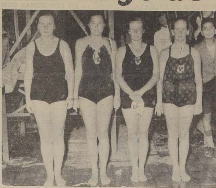
Competidoras que actuaron en los saltos ornamentales.