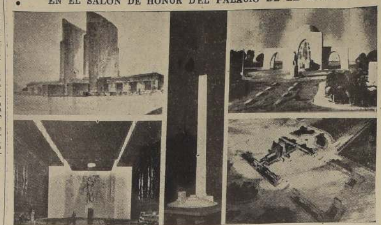
Algunos de los trabajos presentados en el concurso del "Santuario de la Patria", y que se exhiben en el Salón de Honor, de la Moneda.

El concurso abierto por la Presidencia de la República para obtener la participación de nuestros arquitectos y artistas en el proyecto de monumento pro Santuario de la Patria, ha sobrepasado todas las expectativas. En efecto, a pesar del corto plazo, la concurrencia de participantes ha sido muy numerosa, lo que se considera un verdadero éxito.