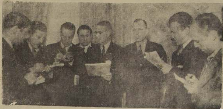
Periodistas de la capital durante la conferencia de ayer