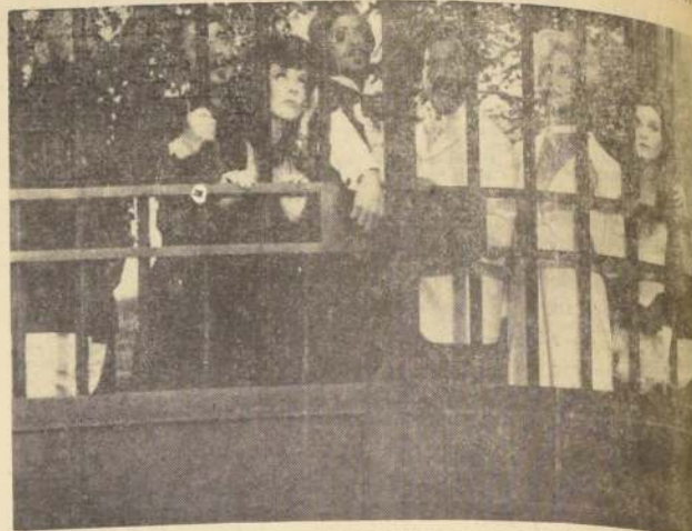
El grupo de locos que por un momento participaron en un poético ballet cinematográfico en "Un Rey por Inconveniencia", se encierra voluntariamente en su "asilo", huyendo del mundo exterior que se destruye con la guerra.