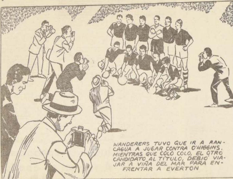
WANDERERS TUVO QUE IR A RANCAGUA A JUGAR CONTRA O'HIGGINS, MIENTRAS QUE COLO COLO, EL OTRO CANDIDATO AL TÍTULO, DEBIO VIAJAR A VIÑA DEL MAR PARA ENFRENTAR A EVERTON

FALTANDO UNA FECHA DEL TORNEO DE 1958, WANDERERS Y COLO COLO EMPATABAN EL PRIMER LUGAR CON 33 PUNTOS, DEBIENDO AMBOS EQUIPOS JUGAR SU ÚLTIMO PARTIDO COMO VISITANTES.