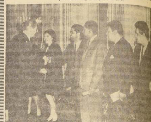
El Frente de Trabajadores de la Salud "Luis Armando Becerra" hizo presente al Estado la necesidad de nivelar la escala de sueldos y otras aspiraciones económicas y sociales de los trabajadores de ese sector.