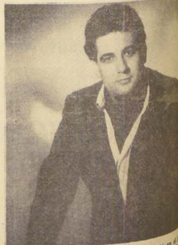
Plácido Domingo, tenor español, que debutó en el papel de Otello en el Teatro Lírico de Buenos Aires. Su hermoso timbre de voz y su facultad de moverse en los registros altos conquistaron al público, que lo premió con cerradas ovaciones.

Mario Miranda nació en Chuquibambilla. Dio sus primeros recitales en el Teatro Municipal de Santiago. Posteriormente, después de intensos estudios en Alemania, debutó en Nueva York. Ha realizado diversas giras por distintos países de Europa. Ha visitado Israel y diversas ciudades de Estados Unidos. Ha dado recitales en el Carnegie Hall. Las críticas del London Daily Telegraph, el London Times y otros periódicos de resonancia mundial, han elogiado sus reservas su virtuosidad y temperamento. Una vez cumplida su actuación en Chile, Mario Miranda viajará a Argentina para dar varios recitales en Buenos Aires.