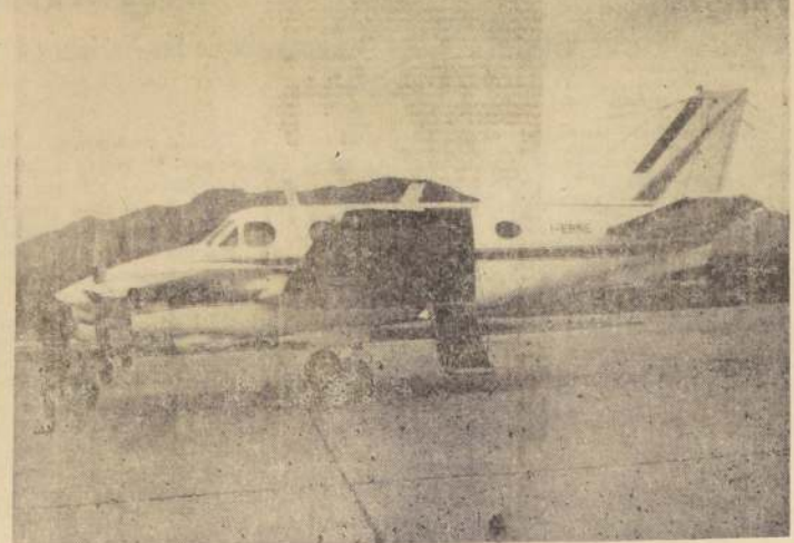
Los que pongan en duda el espíritu moderno de España, aquí tienen una prueba concluyente. Se trata del avión propiedad del famoso torero "El Cordobés", en el cual viaja de una plaza a otra para lidiar las innumerables corridas que despacha cada año. Exactamente lo mismo que un "ejecutivo" norteamericano haría para recorrer sus industrias.