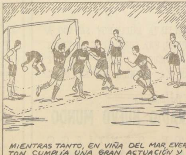
MIENTRAS TANTO, EN VIÑA DEL MAR EVERTON CUMPLÍA UNA GRAN ACTUACIÓN Y DERROTABA A COLO COLO POR EL CATEGÓRICO SCORE DE 3 GOLES A 0.

EN EL SEGUNDO TIEMPO EL EQUIPO PORTENO CONSIGUIÓ OBTENER UN SEGUNDO GOL, CON LO QUE PARECIÓ QUE EL TRIUNFO ESTABA ASEGURADO. PERO JUGADAS DESAFORTUNADAS DE LA DEFENSA PERMITIERON QUE EL EQUIPO DE RANCAGUA LOGRARA EMPATAR MEDIANTE DOS GOLES DE ÚLTIMO MOMENTO. CON ESTE EMPATE, TODO DEPENDÍA DE LA SUERTE QUE CORRIERA COLO COLO.