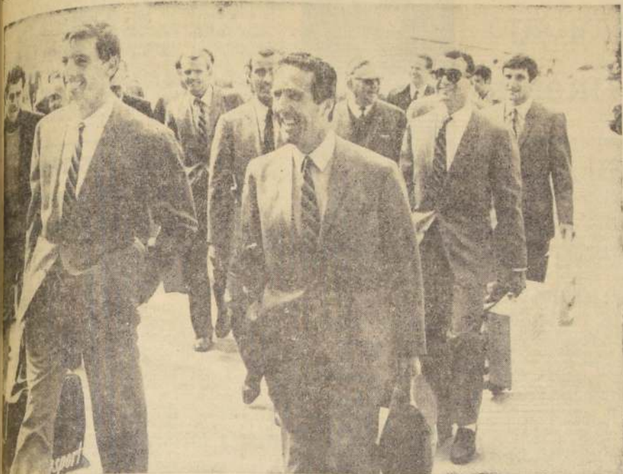
A las 13.30 horas de ayer llegó al aeropuerto de Pudahuel la delegación del famoso equipo italiano de fútbol internacional, quien mañana, en el Estadio Nacional, enfrentará a la Selección Chilena. Por determinación del entrenador del cuadro, Heleno Herrera, que en el gradado aparece en primer plano, los jugadores italianos no recibieron a la prensa ni formularon ningún tipo de declaraciones. Sólo lo harán hoy, luego que entrenen en el Estadio Nacional, a las 9.30 horas.