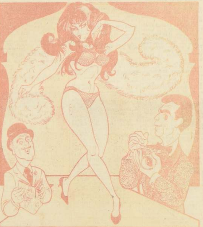
Ann Margret caracterizada tal como aparece en su última película "Deliciosa pecadora", donde interpreta el papel de una artista de variedades.