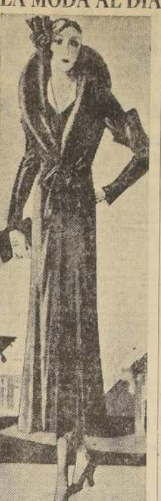
Elegante abrigo de crepé marroquí de seda, con cuello sobrepuesto, piel de zorro, creación de la Casa Paolacci.