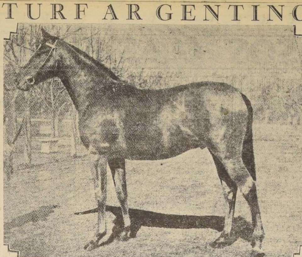
NISO, por Lete y Nivine, y por lo tanto, propio hermano de Niñera, la buena pupila del Stud Hilda. Este potrillo acabó de obtener su primera victoria en Palermo, batiendo por tres cuartos de cuerpo a Presagio, Chiripa, Lazarrillo y cinco adversarios más. El pupilo del Stud Alerta, que lo adquirió en remate del Haras El Martillo, había fracasado en sus dos únicas presentaciones anteriores, lo que le permitió abonar un dividendo de $ 12.35 por cada dos. Niño está al cuidado de J. Santestran y fue dirigido por el jockey O. Solari.

8.ª CARRERA.—800 METROS CHAMPON , 57 (P. Valderrama).—A esta distancia va completamente rebobado. PRIMAVERA , 57 (J. M. Acuña).—A esta distancia, no nos entusiasma ni el caballo ni el jockey. SALAMANDRA , 57 (A. Labi).—Es un buen corredor, pero en esta ocasión, no lo descartamos. OFF , 50 (M. Cantillana).—Cuando venga a ponerse en movimiento, los demás ya estarán en el disco.