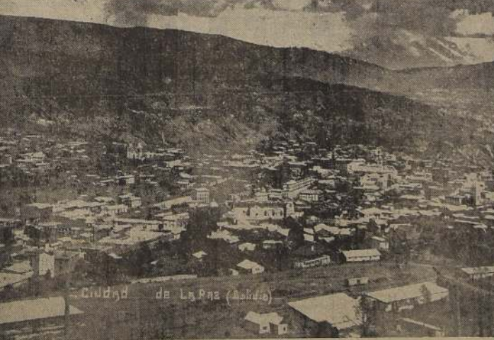
Panorama de La Paz, capital que recibió ayer con grandes honores al Vicepresidente de Estados Unidos y le otorgó el título de ciudadano honorario.

Instantáneamente las banderas del ejército terminaron la ejecución de los himnos de Estados Unidos y Bolivia, una caravana de uniformes militares, cinco mil alumnos de las escuelas, arrojaron flores a su paso en el trayecto. Muchos miles de personas se unieron a estas manifestaciones, que el Vicepresidente agradeció con la mano haciendo el signo de la V de la victoria.