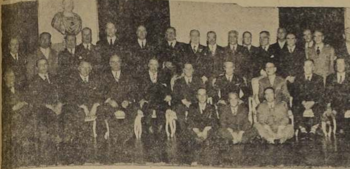
Comida anual del Curso de Alfereces del año 14, servida en el Salón Verde, y que reunió a destacados jefes y oficiales de nuestro Ejército.