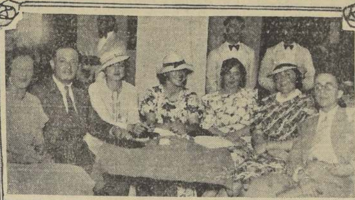
Una simpática familia argentina que veranea en Viña