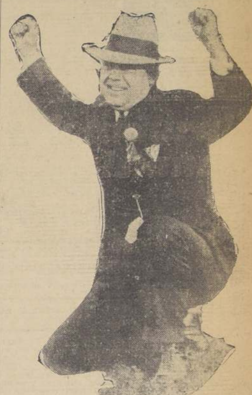
Mr. Huey Long, el "dictador" de Luisiana, contra quien estalló el complot de Baton Rouge

MADRID, 25. — La situación política ha entrado en un periodo de calma. El Presidente Alcalá Zamora ha marchado a la corte temporalmente a Praga y el Premier Lerroux se ha marchado a descansar a Alicante. El Parlamento ha comenzado a estudiar los proyectos de ley programados, en las últimas conferencias entre Lerroux y Gil Robles. La situación ha mejorado considerablemente por Romanones, por los Tribunales militares de los procesos derivados de octubre. Imparcialmente se considera la actual situación política, y que sólo podrá alterarse por acontecimientos imprevistos. Sin embargo, la situación está sujeta a las consecuencias de todo