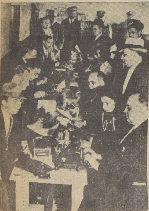
Interior del salón dispuesto para el cable y para el uso de los periodistas en la Corte de Flemington, Estado de New Jersey, que ofrecen al mundo las noticias del caso del secuestro del hijo de Charles Lindbergh