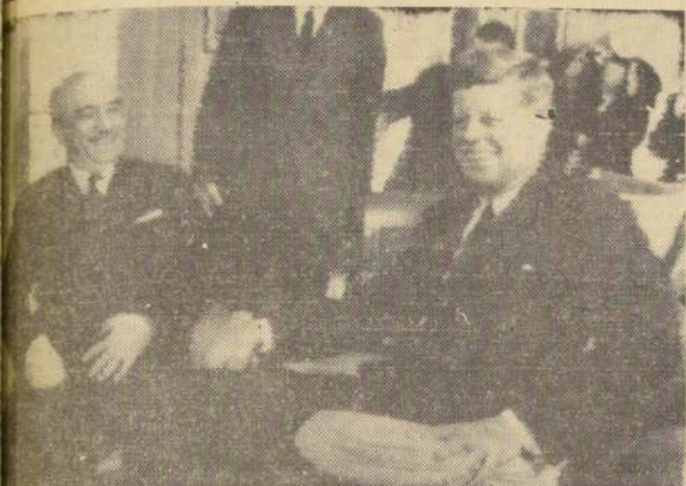
WASHINGTON. — El Presidente Kennedy (a la izquierda) y el Primer Ministro Italiano, Amintore Fanfani, sonríen durante la entrevista que sostuvieron en la Casa Blanca. FANFANI