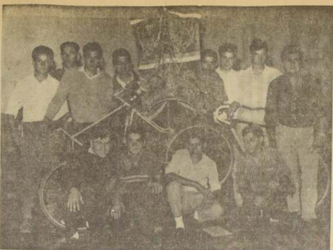
ESPERANZAS: en sus corredores jóvenes, novicios, de cuarta, tercera y segunda categoría, ha puesto su vista, siempre, el Club Ciclista Chacabuco, la veterana entidad pedaleira nacional. Y ha sabido sacar de ellos campeones. Nada de tráficos hechos, ya formados, para hacerse de un nombre o un prestigio. Aquí junto al viejo estandarte, corredores novicios y de cuarta que ya han empezado a cosechar triunfos en la temporada.

Matrícula abierta desde 20 de febrero. HORAS ATENCION: 9.30 a 12 M. — 4.30 a 7 P. M.