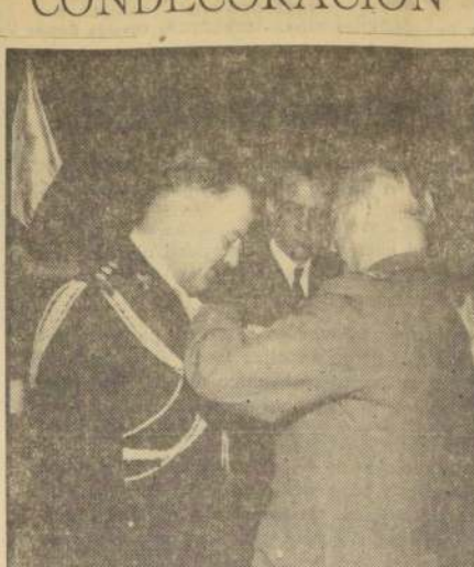
El Agregado Militar de la Embajada de Argentina en Chile, coronel José Carlos Cáceres, fue condecorado con la Estrella al Mérito Militar por el Gobierno de Chile. La condecoración le fue otorgada con motivo del término de su misión en el país. EN EL GRABADO, el jefe del Estado Mayor del Ejército, general Carlos Pollaro, impone las insignias al militar argentino durante la ceremonia realizada ayer.