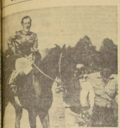
El ganador de "El Ensayo" cumplió un apronte en el Club Hípico. Se decidió no hacerlo en "El Derby" y dejarlo, en cambio, para el "Saint Leger".

CON UN COTEJO DE CALIDAD CUMPLIDO AYER, EL HIJO DE ESPACE VITAL DEMOSTRO SU RECUPERACION