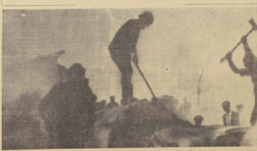
SAO PAULO, Brasil. — Los bomberos luchan por dominar el fuego en el fuzilaje del avión brasileño que se estrelló el martes. Trece personas murieron en el accidente y más de 30 quedaron heridas.