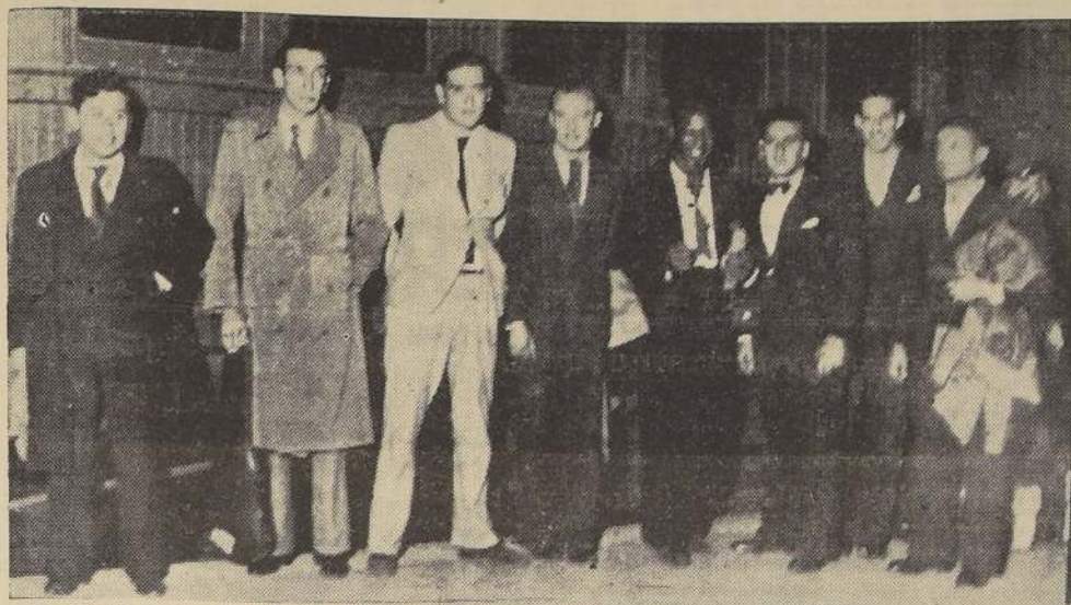
La Orquesta Americana que dirige el gran maestro Al Pratt, a su llegada anoche a la Estación Mapocho por la combinación transandina.