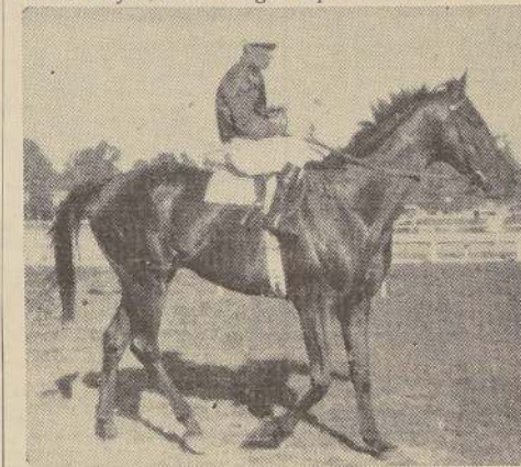
Palais Royal, el mejor "stayer" de las pistas y que pasado mañana debe conquistar la valiosa recompensa de los cuarenta mil pesos del clásico "Ricardo Lyon".

Palais Royal, debe vengar aquí su última derrota