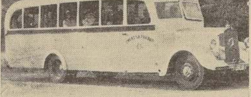
Uno de los omnibus del servicio a Valparaíso que se inaugurará mañana y que aver cumplió una prueba satisfactoria hasta Curacavi

Mañana, a las 8.15 horas, será inaugurado el nuevo e inmediato servicio de omnibus para pasajeros entre Santiago y Valparaíso, que habrá de llamar la atención por sus condiciones de seguridad y confort.