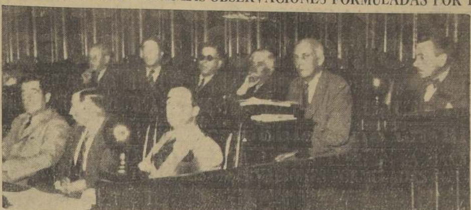
El Ministro de Hacienda, señor Ross, en los momentos en que pronunciaba anoche en la Cámara su discurso refutando las objeciones al convenio Ross-Calder

En la sesión de mañana, el señor don Teófilo Ruiz Rubio, presidente de la Cámara, anunció que la votación había terminado y que se daría cuenta de ella en la sesión de mañana.