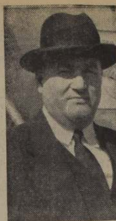
JUAN JOSÉ AREVALO Ex P. de Guatemala, llegó ayer a Santiago por el Interamericano de la Panagra, procedente de Buenos Aires. El señor Arevalo viajaba en misión diplomática y se encuentra visitando varios países sudamericanos. A su llegada fue recibido por funcionarios de Gobierno, por miembros de la colectividad guatemalteca residente y por sus numerosos amigos chilenos.

El objeto de esa disposición ha sido el de financiar el pago de gastos de material y trabajo extraordinario, que demandó la edición de ese día, ya que por el número excesivo de decretos con fuerza de ley que publicó el número de ese día, considerándose el número de sus páginas.