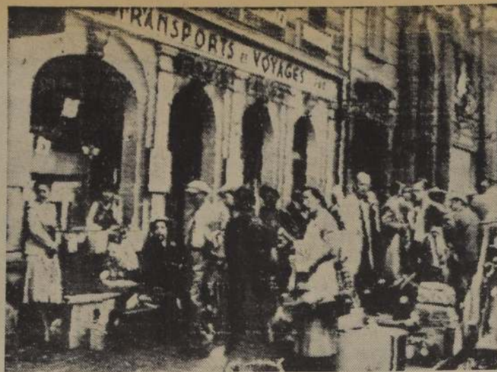
PARIS. — Algunos turistas esperan frente a una agencia de viajes con sus maletas, para partir hacia Le Havre, cuando cientos de miles de obreros interrumpieron las comunicaciones y medios de transporte en toda Francia.

En la reunión que celebró el Comité Central del Partido Comunista norcoreano en Pyongyang, del 5 al 9 de agosto, se decidió nombrar tres nuevos subsecretarios del comité: uno de ellos es Pak Chong Ae, la única mujer de este triunvirato, que preside, con el título de secretario general, Kim Il Sung.