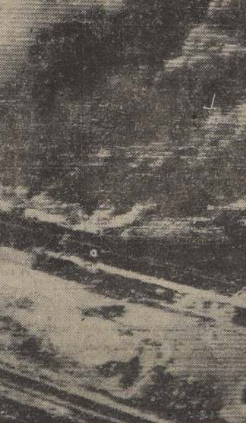
GIGANTESCO INCENDIO EN DETROIT. —Nubes de humo surgen de la planta de transmisión de la General Motors, en Detroit, durante el incendio que provocó pérdidas por 40 millones de dólares y la muerte de dos personas. La usina quedó totalmente destruida. Muralas y armazones fueron destruidos por el calor. Se cree que el fuego fue provocado por la llama de un fundidor.

TEXTO DEL DECRETO El siguiente es el texto completo del decreto en referencia, que lleva el número 119 y firmaron S. E. y los Ministros de Minería, Economía y Hacienda, y que se encuentra hoy en trámite.