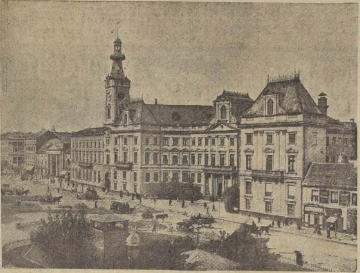
Edificio de la Municipalidad de Varsovia, ubicado en la Plaza del Teatro.

La situación más interesante continúa siendo la del ahora reducido bolsón nazi, donde los restos de tres de los ejércitos atacantes del mariscal de campo Von Rundstedt están comprimidos en una estrecha faja de territorio belga-luxemburgués; un despacho procedente del frente informa que los aliados están ya en la fase final