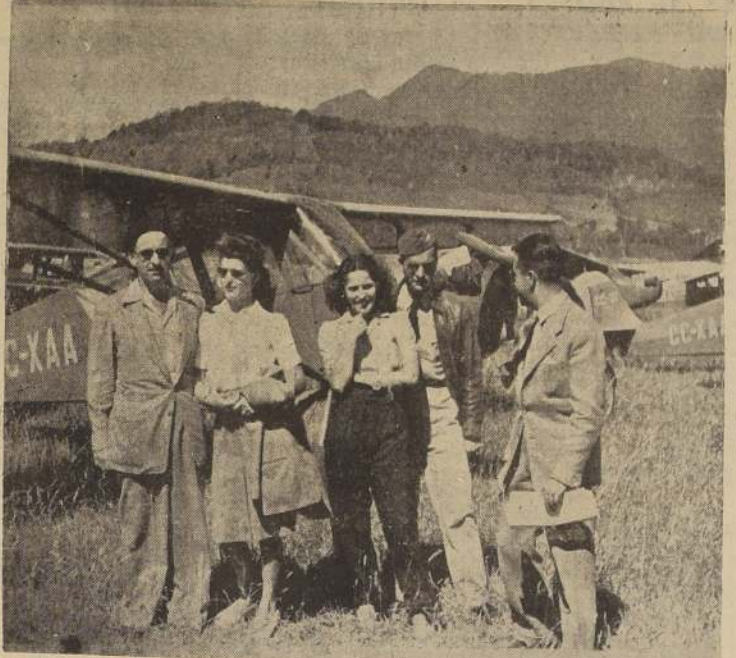
Pasajeros en el Aeropuerto del Gran Hotel Termas de Puyehue, establecimiento que cada día se ve más concurrido por lo más selecto del país y del extranjero.