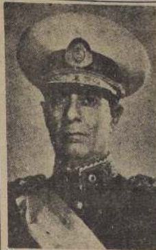
El General Pedro Ramírez, miembro de la Junta de Gobierno