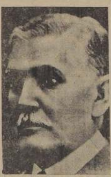
El General Rawson, jefe del movimiento y Presidente de la Junta de Gobierno

Los miembros del gabinete solicitaron permiso para desembarcar y pasar la noche en tierra. Se informa que el Gobierno uruguayo estudia actualmente ambas solicitudes.