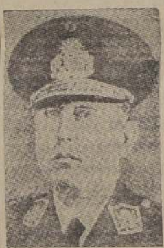
El General Rawson, ex Ministro de Guerra, quien se ha adherido al movimiento revolucionario.

A medida que las fuerzas del ejército avanzaban sobre la ciudad, hubo gran ansie-