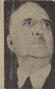
El General Rawson, jefe del movimiento y Presidente de la Junta de Gobierno