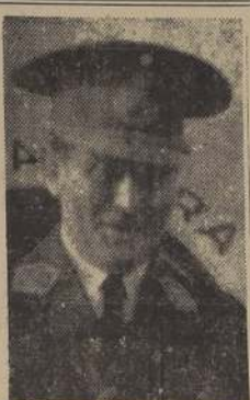
El General Rawson, jefe del movimiento y Presidente de la Junta de Gobierno