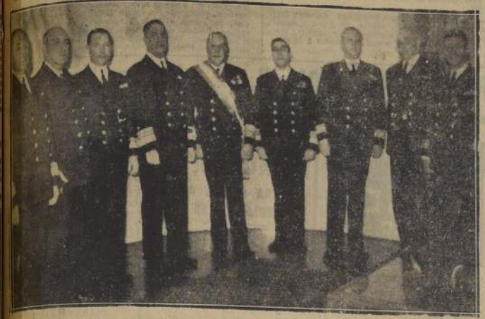
El almirante señor Vicente Merino Bellic, acompañado de los almirantes en servicio activo durante la entrega de la insignia presidencial.

JEFES DE LA ARMADA OBSEQUIARON BANDA PRESIDENCIAL AL ALMIRANTE SEÑOR MERINO