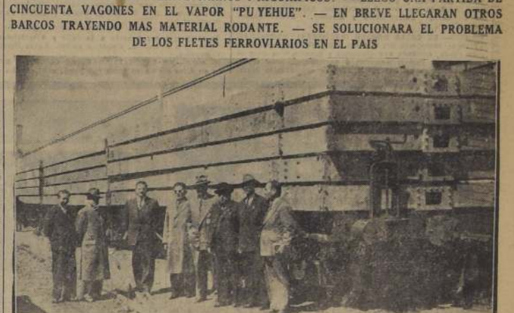
Los periodistas de Santiago acompañados de funcionarios de la Empresa de los Ferrocarriles y de la Aduana de Valparaíso, frente a varios carros cargados con plataformas de los vagones adquiridos en Estados Unidos.

1.250 CARROS DE CARGA HA ADQUIRIDO LA EMPRESA DE LOS FERROCARRILES EN EE. UU. ENTRE ELLOS FIGURAN VEINTE CARROS FRIGORIFICOS. — LLEGO UNA PARTIDA DE CINCUENTA VAGONES EN EL VAPOR "PUYEHUE". — SE EN BREVE LLEGARAN OTROS BARCOS TRAYENDO MAS MATERIAL RODANTE. — EN SOLUCIONARA EL PROBLEMA DE LOS FLETES FERROVIARIOS EN EL PAIS