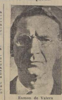
Eamon de Valera