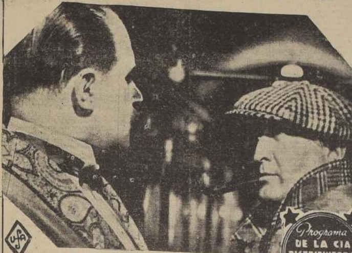
ADMIRE UD. AL NOTABLE ACTOR ALEMAN

Siga usted las incidencias, las aventuras y las sorpresas de una obra que lo mantendrá en constante tensión nerviosa.