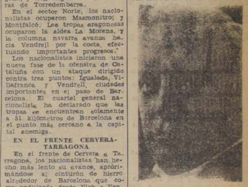
D. Lloyd George

Atacó energicamente al Premier y su política en un discurso en Gales