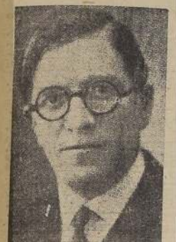
J. Alvarez del Vayo

Pidió sesión secreta al Consejo de la SDN, para tratar estos asuntos