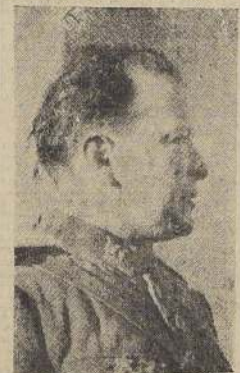
GUALBERTO VILLARROEL Presidente de Bolivia.

EL CORONEL VILLARROEL FUE ESCAPADO ILIBRO