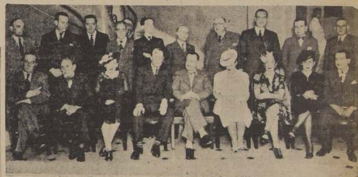
Asistentes a la comida en honor del nuevo Directorio del P. E. N. Club.