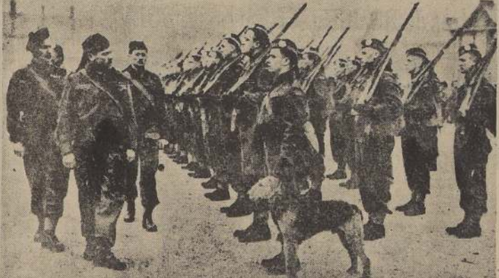
Arriba, aviones británicos se alejan de sus bases en un aeródromo de Gran Bretaña después de su reciente excursión sobre la isla alemana de Heligoland, donde libraron con los alemanes la batalla aérea más grande de la historia. Abajo, el primer contingente de soldados canadienses es revisado en un puerto británico, a su llegada de América, antes de ser enviados al frente occidental.