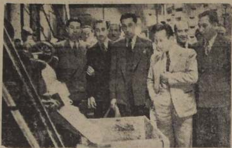
Congresales visitando el Laboratorio Chile