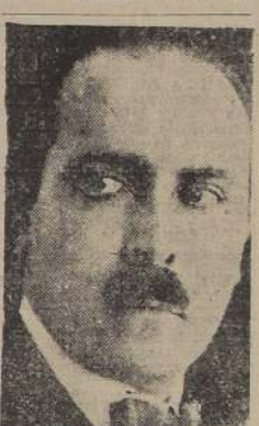
Don Carlos Arroyo del Río, presidente Electo del Ecuador

La persistencia de las lluvias ha beneficiado las huertas de Cuenca y Segura, donde los cultivos de hortalizas, talavera y quiepar han almacenado 25.000.000 de metros cúbicos de agua.