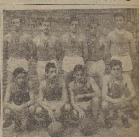
INSTITUTO NACIONAL.— Técnico conjunto que hoy disputa con el Internado Nacional Barros Arana el título en la división superior del torneo escolar del básquetbol metropolitano.