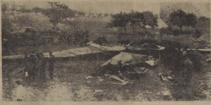
CHOQUE AEREO SOBRE ALEMANIA.— Dos bi motores de transporte C-47, de los que hacen el servicio de abastecimiento de Berlín, chocaron en su viaje de regreso a Francfort, sobre la localidad de Bavishausen. La foto muestra los restos de uno de los aviones.