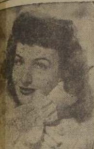
Greer Garson en la pantalla del Metro