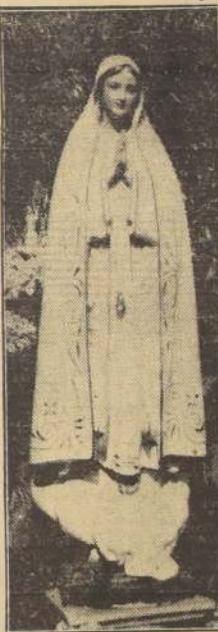
La visión de Fátima parece haberse repetido en Italia, según las informaciones del cable.