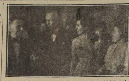
Bidault, Marshall, y las señoras de Bidault y Molotov, durante una recepción en Moscú.

Molotov recordó gran parte de su discurso a recordar las discusiones de los tres grandes sobre el desmembramiento de Alemania, y dijo que en Teherán, Roosevelt sugirió la división de Alemania en cinco Estados, que solo en Potsdam los Tres Grandes abandonaron completamente la idea de desmembrar a Alemania y acordaron su unificación.