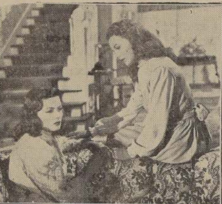
Gene Tierney y Jeanne Crain en una escena de la interesante producción "Que el cielo la juzgue" que se conocerá en martes en la pantalla del Teatro Rex

Gene Tierney ha encontrado en la película "Que el cielo la juzgue" el papel que necesita