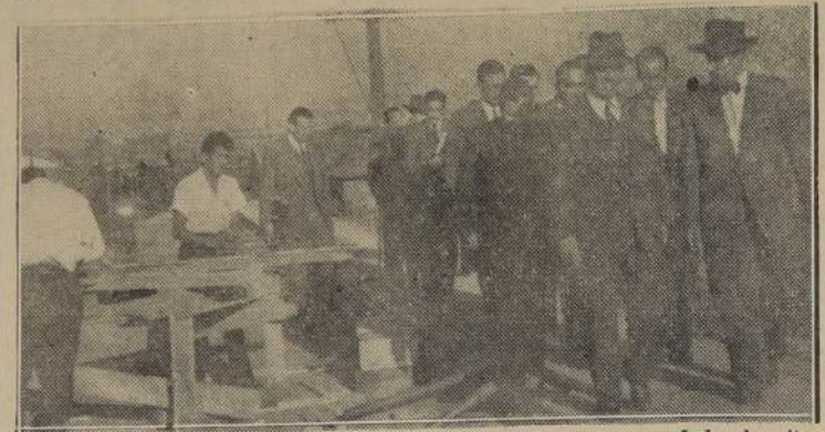
El Ministro de Obras Públicas, señor Carlos Contreras Labarca, acompañado de altos jefes de servicios del Ministerio, y periodistas, durante la visita al paso sobre nivel de Carrascal.