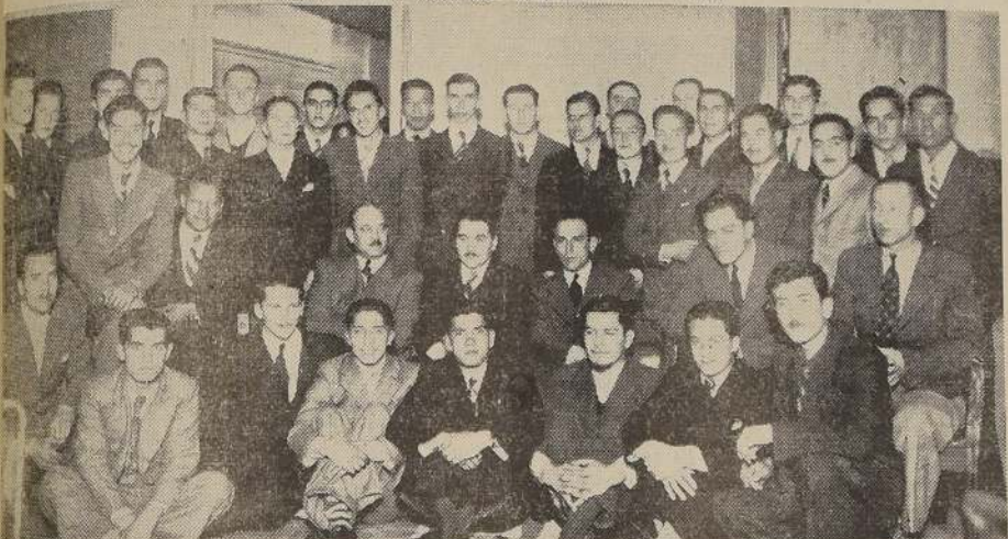
Los profesores y alumnos de la especialidad de mecánica de la Escuela Técnica Industrial de la E.A.O., despiden a los compañeros que egresan el presente año recibiendo de técnicos mecánicos.—El cocktail fue servido en el Salón de Té LUCERNA.