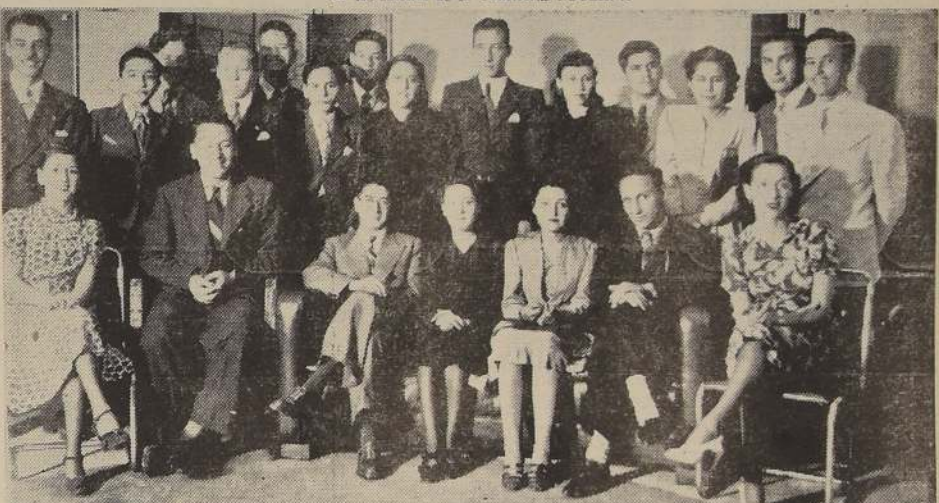
Manifestación que ofrecieron los alumnos del Liceo Sarmiento con motivo de despedirse del presente año.— El té se sirvió en el Salón de la Confeitería LUCERNA.