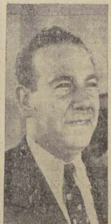
Captán de bandada don Oscar Silva Mora, Director accidental de la Línea Aérea Nacional.

Una reseña de lo que es la organización de este moderno servicio nacional de transporte aéreo. — Con un porcentaje casi nulo de accidentes, la "Lan" figura en la estadística británica a la cabeza de las líneas aéreas del mundo