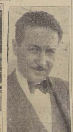
Comodoro del Aire en retiro don Arturo Merino Benítez, Presidente del Consejo de la Línea Aérea Nacional.

Partes de la correspondencia que llega habitualmente del Norte en las modernas máquinas LAN.