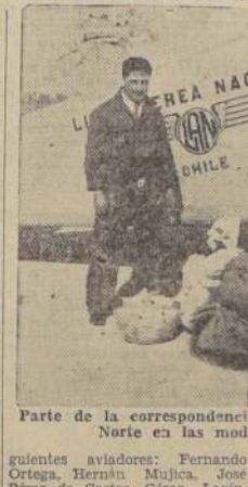
Comodoro del Aire en retiro don Arturo Merino Benítez, Presidente del Consejo de la Línea Aérea Nacional.