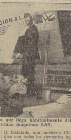
Capitán Bisquert, un avión de la Línea Aérea Nacional.