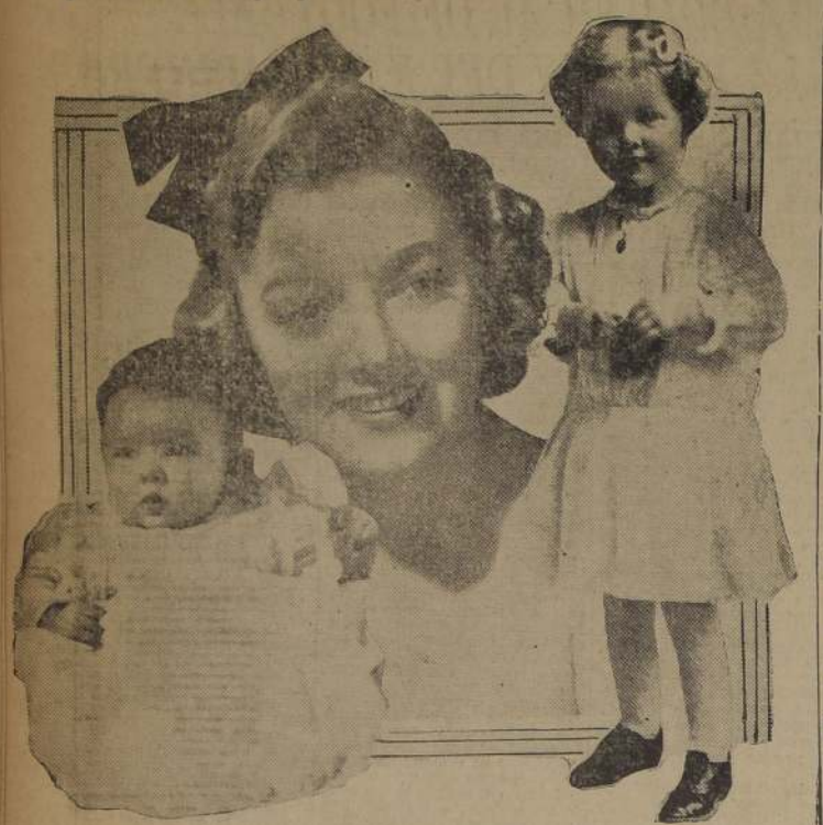
Myrna Loy de 6 meses Myrna Loy de 3 años Myrna Loy de 10 años