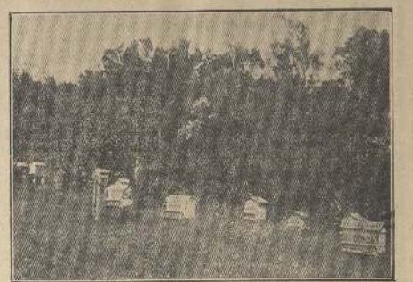
Vista parcial del colmenar

Debido al crecimiento bastante lento y a ser en su mayoría de hoja perenne, los árboles originarios del país, aunque muy hermosos, no son recomendables para las plantaciones en líneas en las ciudades.