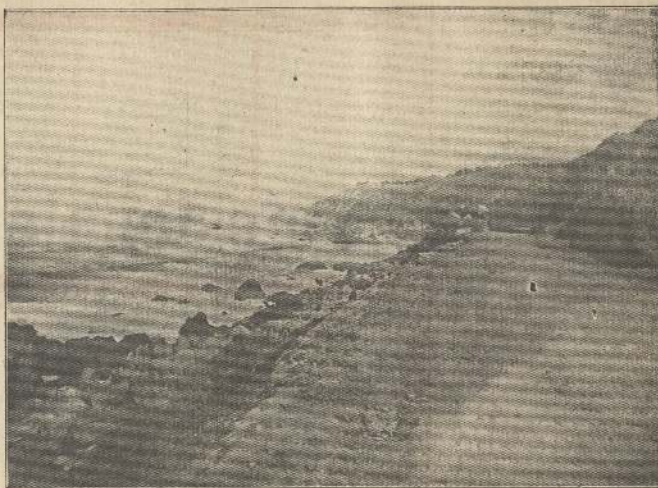
Camino de Concepción a Montemar, sección Refaña, al llegar al Bosque

didias para evitar que continúe este estado de cosas.