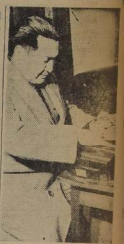
tanto práctica como teóricamente.