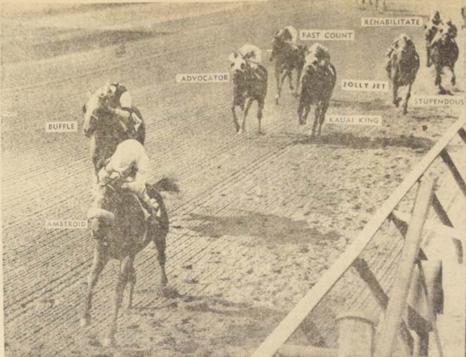
AMBEROID derrotó a Buffle, Advocate y Kauai King en el Belmont Stakes, el punto de la Triple Corona del turf norteamericano. En esa competencia, Kauai King perdió su oportunidad de ganar la enigmática corona. No fue capaz de ejecutar el excelente ejemplo de repetir sus anteriores presentaciones. (UPI).

El aumento por el mejoramiento de las apuestas de la Triple Final dio lugar a un valor nominal de $ 4.047,20.