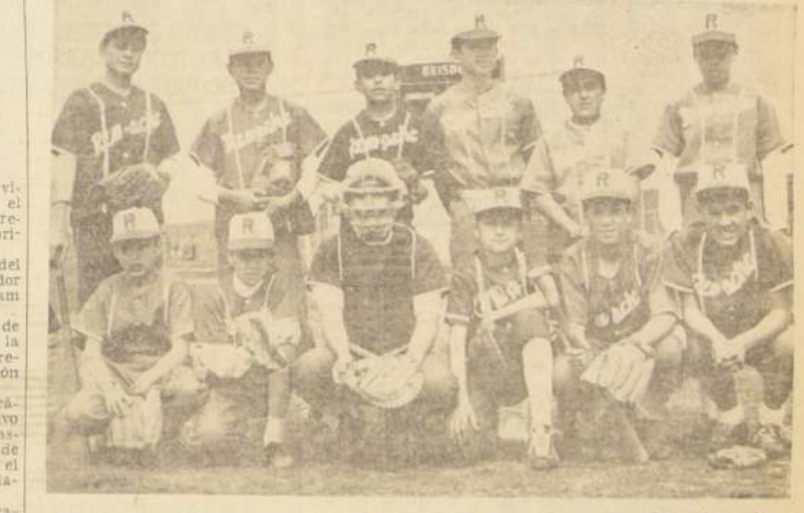
REMACHE se vio sorprendido por el rendimiento parejo de sus vencedores. Los entusiastas defensores de Universidad Católica B. No pudieron batear con comodidad los pequeños remachinos, disminuyendo por consiguiente sus posibilidades de ataque.

Una de las armas principales que fundamentaron el triunfo católico fue la coordinación y entendimiento demostrada en la cancha por los jugadores.