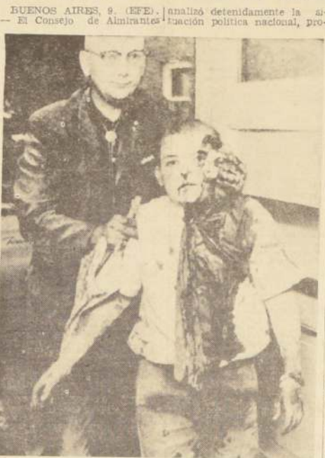
TOPEKA, (Kansas).— Sacerdote auxilia a pequeño que resultara herido por un tornado ayer 9, fenómeno atmosférico que afectó esa región, conjuntamente con el huracán que afecta el Golfo de México.— (Radiofoto UPI).

Una compañía de la División 101 Aerotransportada norteamericana maniobró para cerrar las salidas del Valle de Dakleng, ubicado unos 480 kilómetros al norte de Saigón, donde se halla la mayor parte de la quedada de una gran fuerza regular comunista.