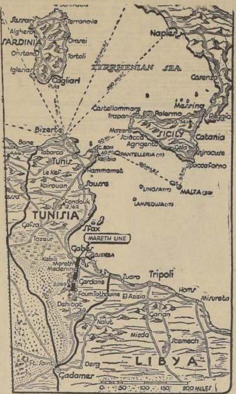
Después de seis poderosos asaltos desbaratados por el aguerrido ejército de Montgomery, el Mariscal von Rommel, se ha replegado hacia Medenine, donde reorganiza sus fuerzas para iniciar nuevas embestidas.