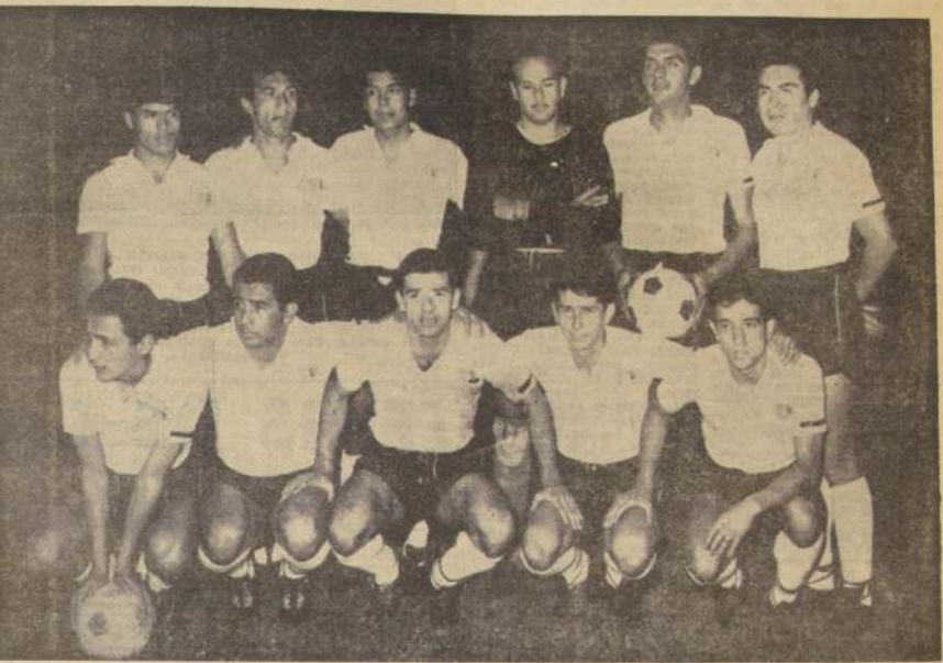
COLO COLO! — El cuadro popular, fue el que expuso más regularidad a lo largo de la temporada oficial próxima a finalizar. Con todo, se mostró flojo en las jornadas recientes, dejándose alcanzar por la "U", a quien llegó a aventajar en siete puntos. Su carta decisa la juega frente a la U.C.

MARLENE AHRENS fue de nuevo en 1963, la figura de nuestro deporte. Alta majestosa e imponente la vimos triunfar, sin esfuerzo, en la prueba de su especialidad, en el importante evento que fueron los Juegos Panamericanos desarrollados en la bella Sao Paulo, cuyo público la hizo objeto de una ovación. Vibraron en su espectacular victoria en Pacembá, que la consagró otra vez como la mejor jiralista panamericana, y más tarde, a la distancia, volvió a brindarnos la emoción de su triunfo en el Sudamericano de Colombia, donde, superando la pena que la embargaba por el fallecimiento de su progenitor, dio cuenta de sus portadas adversarias. Dos veces estuvo, pues, en la tarima de los campeones, envuelta en una sonrisa emocionada, mientras llegaba al tópe del mastil olímpico nuestro emblema nacional. ¡Viva Marlene! Hubo también en Sao Paulo, otra nota grata para nuestro deporte, ofrecida por un muchachote panamericano, trayendo la medalla de oro de los campeones. Este fue Misael Vilugron, que saltó de golpe al primer plano de nuestros mejores deportistas del año 1963, mostrando en clase de excelente pugilista. También lo vimos sonriente en tanto le prendían el galardón, escena que se repitió en el último Torneo Nacional del Boxeo Aficionado. Por la figuración que les cupo en tan notables jornadas, tanto Marlene Ahrens como Misael Vilugron se han hecho acreedores al "Medallón" de LA NACION.