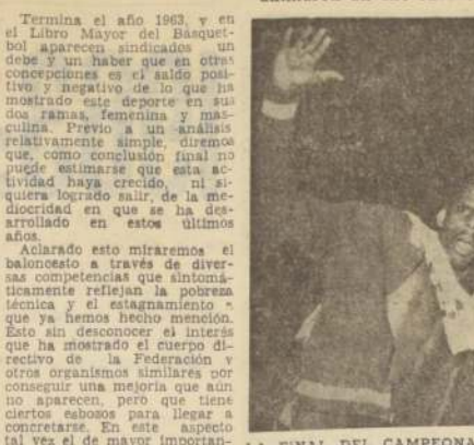
LA FINAL DEL CAMPEONATO DE SANTIAGO alcanzó contornos dramáticos. En tres sets hubo que definir el título, el que quedó, por cuarta vez consecutiva, en manos de Unión Española, al vencer a Colo Colo.

En el terreno internacional la actuación en Lima, de los varones, fue decepcionante. Las "estrellas" mostraron gran progreso en Panamericano, de Sao Paulo. Finales de los campeonatos metropolitanos animaron un año oscuro para este deporte.