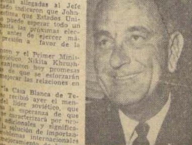
LYNDON B. JOHNSON

HOUSTON, Texas, 1.º (UPI). — El Presidente Lyndon B. Johnson exhortó hoy al mundo "a hablar menos y a hacer más" en favor de la paz. En su discurso, el Presidente norteamericano dijo que en 1964 realizará una "ofensiva inflexible" en favor de la paz y de mejorar las relaciones con la Unión Soviética. Personas allegadas al jefe de Estado indicaron que Johnson espera que Estados Unidos pueda esperar tanto un año de paz como un año de guerra, antes de las próximas elecciones, antes de ejercer más presión a favor de la paz.