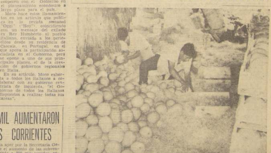
Otro de los éxitos de la aplicación de la Reforma Agraria en nuestro país, lo constituye la alta producción de frutas que se ha obtenido en las colonias, gran parte de la cual es exportada al extranjero, principalmente a los Estados Unidos, con la consiguiente entrada de divisas. En el grabado, dos campesinos que ahora explotan su propia tierra en la colonia "Fernando Bono Morandé", seleccionan una partida de melones que viajará con destino a mercados norteamericanos.