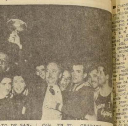
LA FINAL DEL CAMPEONATO DE SANTIAGO alcanzó contornos dramáticos. En tres sets hubo que definir el título, el que quedó, por cuarta vez consecutiva, en manos de Unión Española, al vencer a Colo Colo.

Termina el año 1963, y en el Libro Mayor del Básquetbol aparecen, sin embargo, un debe y un haber que en otras concepciones es el saldo positivo y negativo de lo que ha mostrado este deporte en sus dos ramas, femenina y masculina. Previo a un análisis relativamente simple, diremos que, como conclusión final no puede estimarse que esta actividad haya crecido, ni siquiera logrado salir, de la mediocridad en que se ha desarrollado en estos últimos años.