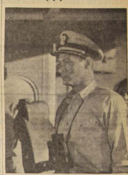
"PROA AL SOL", con censura para menores es una de las más apasionantes e impresionantes películas de los infantes de marina. Para muchos supera a "El día más largo del siglo". Lex Barker, el apuesto y fornido Tarzán, es el héroe de esta película que Universal presenta con censura para mayores y menores en el cine Ducal. Perfecta de técnica y en preciosos colores.

TIVOLI (Huertano 737 - 30611) - 11 horas: Rocío 10. Not. TOESCA (Huertano 1313 - 62389) - 11 horas: Las parisienas. Manon. Ángel pecador. MUNICIPAL (San Bernardo) - 14 horas: Anatomía de un asesino y El espejo desnudo. NACIONAL (Pueble Alto) - 14 horas: Vamos para la feria. Los tres chiflados en órbita. El principio y el fin. PALACE (Ovalle - 581616) - 14 horas: Dos son culpables. El principio negro y El diablo nunca duerme. SANTIAGO (San Bernardo) - 14 horas: Dos son culpables. El principio negro y El diablo nunca duerme. CERVANTES (San Antonio) - 14.30 horas: El espasmo de Sanar. Pequito, el valiente y La princesa y el plebeyo.