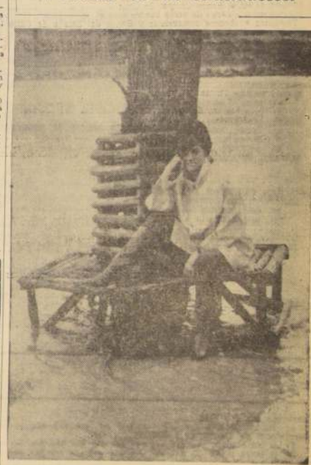
CLAUDIA CARDINALE parece estar sufriendo las mismas contrariedades que los vecinos a los ríos Aconcagua o Maipo. Pero a ella la inundación la sorprende en la ciudad española de Toledo, donde las fuertes lluvias impidieron durante varios días la filmación de la cinta "Circos" en la que trabaja la buena actriz italiana, junto a John Wayne y Rita Hayworth. Muchos se preguntarán al ver aislada por las aguas a Claudia Cardinale, ¿qué hacen los bomberos y la Defensa Civil de Toledo que no acuden en su inmediata ayuda?