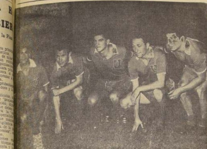
DELANTERA, que sabe su oficio nos presentado la "U" en su campaña del pasado. Después de su exitoso comienzo en el torneo del 62 y de su brillante actuación internacional, el cuadro oficial empezó flojo el campeonato del 63.