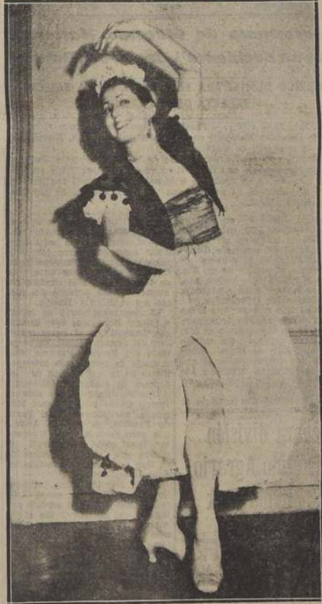
PARIS. — La foto nos muestra a la bailarina española Mariemma, bailando la danza "Los Panaderos" con el traje nacional catalán. Mariemma baila en una forma que hace recordar a la gran bailarina "La Argentinista", y ha recibido estruendosas ovaciones en Portugal, Holanda, Bélgica y Dinamarca.