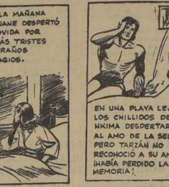
EN UNA PLAYA LEJANA, LOS CHILLIDOS DE NKIMA DESPERTARON AL AMO DE LA SELVA. PERO TARZAN NO RECONOCIÓ A SU AMIGO. HABÍA PERDIDO LA MEMORIA.