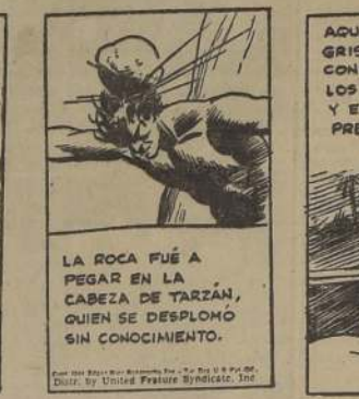
LA ROCA FUE A PEGAR EN LA CABEZA DE TARZAN, QUIEN SE DESPLOMO SIN CONOCIMIENTO.