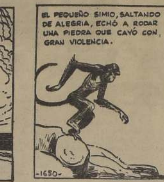
EL PEQUEÑO SIMIO, SALTANDO DE ALEGRIA, ECHÓ A RODAR UNA PIEDRA QUE CAYÓ CON GRAN VIOLENCIA.