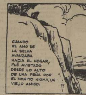
CUANDO EL AMO DE LA SELVA AVANZABA HACIA EL HOGAR, FUE AVISTADO DESDE LO ALTO DE UNA PEÑA POR EL MONITO NKIMA, UN VIEJO AMIGO.