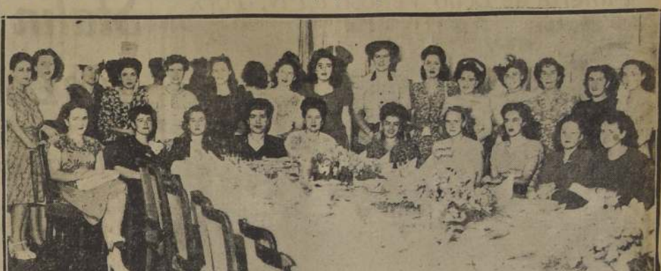
Asistentes a la manifestación con que la Asociación de Enfermeras Universitarias dió la bienvenida a las alumnas recién egresadas de la Escuela de Enfermeras de la Universidad de Chile.