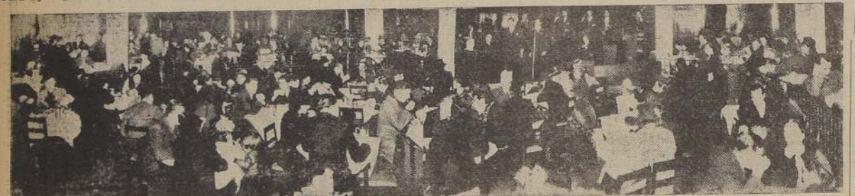
Artista: Fred Astaire, Eleanor Powell y George Murphy, los mejores bailarines del mundo, principales intérpretes de la grandiosa ley musical "LA MELODIA DE BROADWAY DE 1940", en cuyo homenaje se ha organizado el GRAN CONCURSO DE BAILES MODERNOS que comenzará el próximo DOMINGO 23, en el gran salón del LUCERNA.