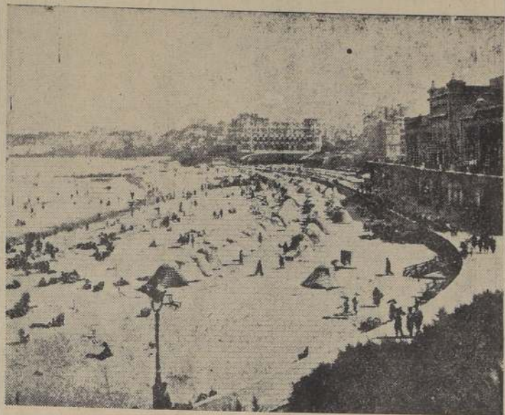
La gran Playa de Biarritz

SAN SEBASTIAN, 31. — (U. P.).— Se informa en la mañana, que el Gobierno francés no iría a Biarritz, sino a Perpignan.