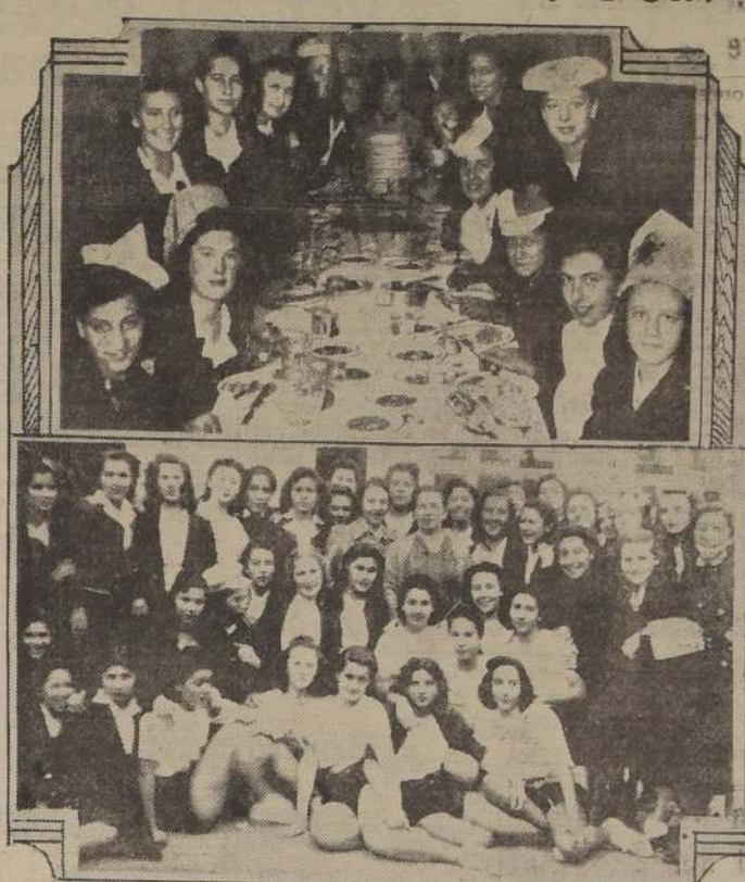
Alumnas del Liceo N.º 1 "Javiera Carrera". Arriba: durante las once servidas en los comedores del establecimiento. Abajo: participantes en el campeonato de Basquetball.