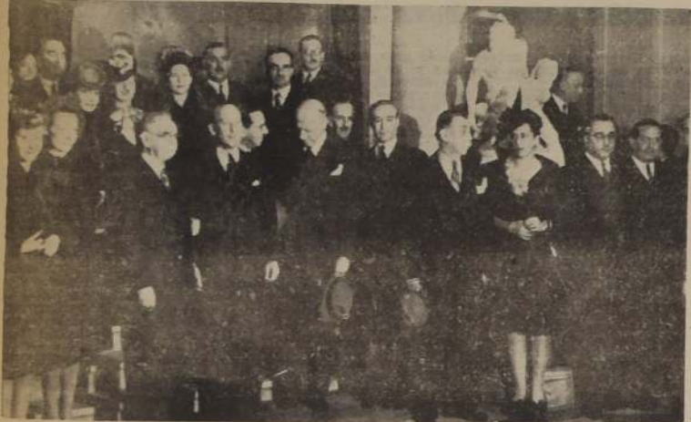
Parte de los asistentes a la inauguración del Museo y Biblioteca del Teatro Municipal