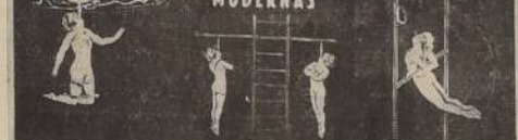
EL VALOR Y LA AUDACIA DE LAS MUJERES MODERNAS

re acondicionado, higiénico, fresco y agradable. Mañana viernes 21 habrá una única función nocturna: el Sábado 22, dos funciones: matinee a las 5.30 de la tarde y nocturna a las 9.40; el Domingo 23 tres funciones.