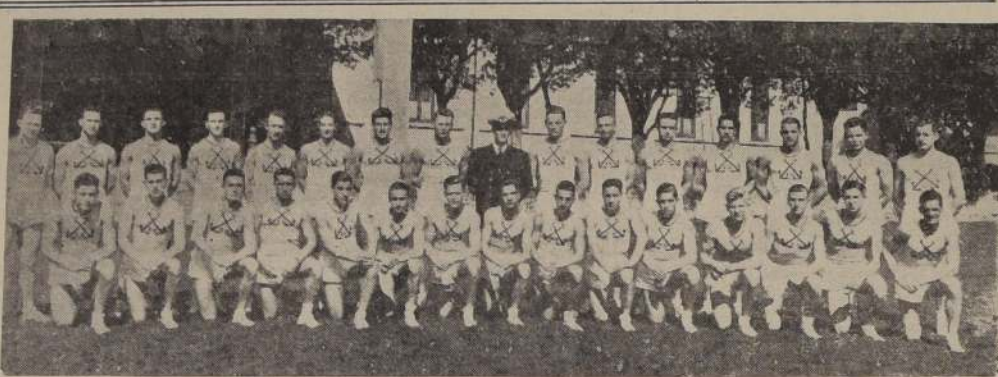
ATLETISMO.—Cadetes que representarán a la Escuela Naval en la Olimpiada Militar, que empieza el sábado en la tarde en el Estadio Nacional. Se trata de una competencia que ha llamado la atención.