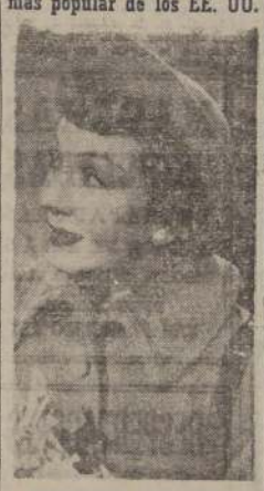
HOLLYWOOD, 19. — (UP). — La encuesta anual sobre popularidad en el cine que efectúa la revista "Women's Home Companion" reveló hoy que Ingrid Bergman, quien obtuvo el primer lugar durante tres años consecutivos, ha descendido ahora al décimo puesto.

C. Colbert es la actriz más popular de los EE. UU.