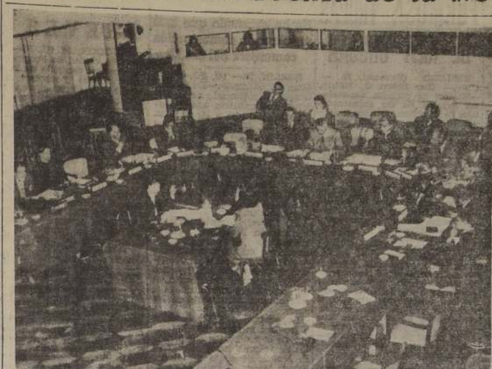
MONTEVIDEO. — La Subcomisión de las Naciones Unidas sobre Libertad de Información y Prensa, se está reuniendo actualmente en el Parque Hotel de Montevideo.

Dijo que no se trata de imponerles el código, sino que ellos mismos lo impongan. Binder contestó: "Eso estoy convencido que el código sea deseable ni viable. Mucho de su contenido es extraño al pensamiento de mis compatriotas".