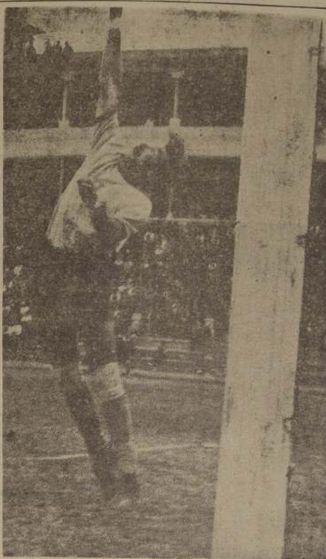
Tendrá mucho trabajo mañana SERGIO LIVINGSTONE, el gran arquero chileno, frente a una delantera que será dirigida por el crack Jorge Robledo. El popular guardameta está dispuesto a entregar invicta la valla de su club. Ahí veremos.