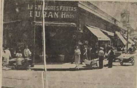
Seis ambulantes frente a un prestigioso establecimiento del Mercado Central

NUESTRO DERECHO DEBE SER AMPARADO NOS DICEN LOS LOCATARIOS