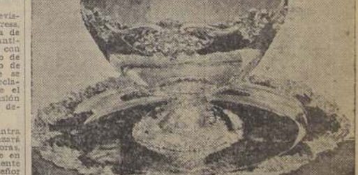
El magnífico trofeo Copa Davis, que estos días disputarán, en los partidos definitivos, los equipos de Francia y Norteamérica.

El presente decreto-ley entrará en vigencia desde su publicación en el "Diario Oficial".