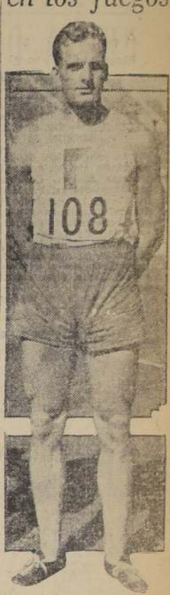
Franz Douda, el destacado lanzador checoslovaco, que a pesar de haber quebrado el record mundial de la bala el 23 de abril, en Praga, con 16 metros 5 centímetros, en Los Angeles se clasificó tercero con 15 metros 51