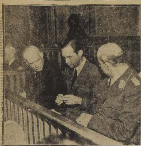
Los responsables de la matanza de las cavernas de Ardeatine. Ante el Tribunal que los juzga en Roma. En ese luctuoso suceso fueron ametrallados 300 italianos como represalia por un atentado dinamitero contra el Cuartel General alemán. En la fotografía aparecen, de izquierda a derecha, el general Eberhard von Mackensen, un intérprete y el teniente coronel Kurt Maeltzer.