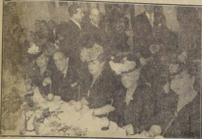
Aspecto parcial de la distinguida concurrencia que asistió a la comida de beneficencia que tuvo lugar en la Hostería de Providencia pro ayuda a la infancia desvalida de Chile e Italia.