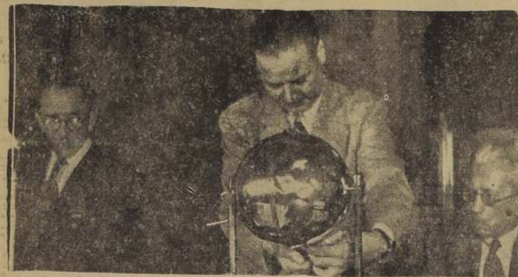
Durante el sorteo