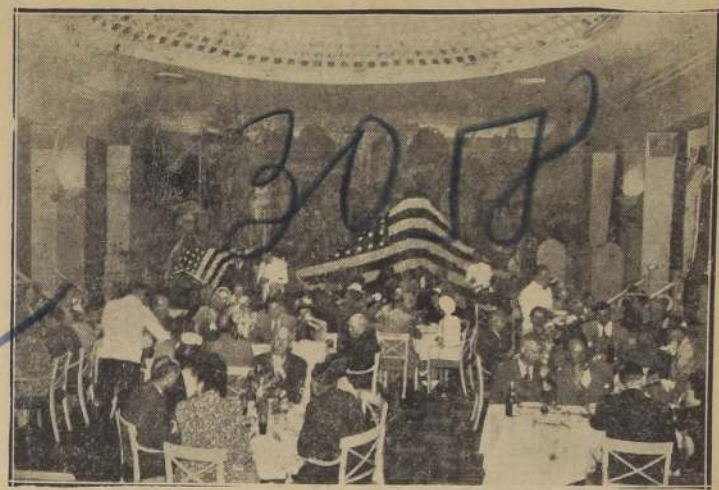
Asistentes al almuerzo de la colonia norteamericana, presidida por S. E. el Embajador Bowers, con ocasión del Día de Gracias del país amigo