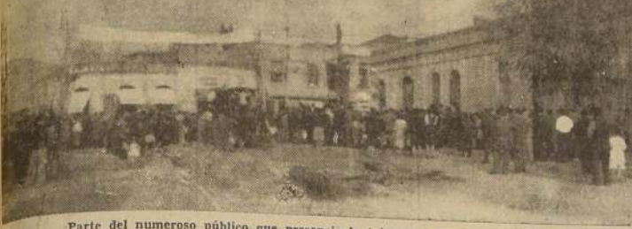
Parte del numeroso público que presencio la iniciación de los trabajos

ESTAS OBRAS SON DE GRAN IMPORTANCIA PARA UNO DE LOS MAS POPULOSOS SECTORES DE LA CAPITAL. — EN EL ACTO ESTUVIERON PRESENTES AUTORIDADES Y NUMEROSOS VECINOS