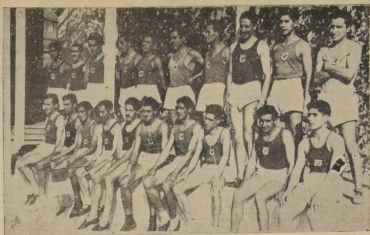
BUENA PERFORMANCE.— El equipo de Stade Français, que destacó una estimable performance al adjudicarse la "Posta de las Américas". Es una prueba que debe repetirse.