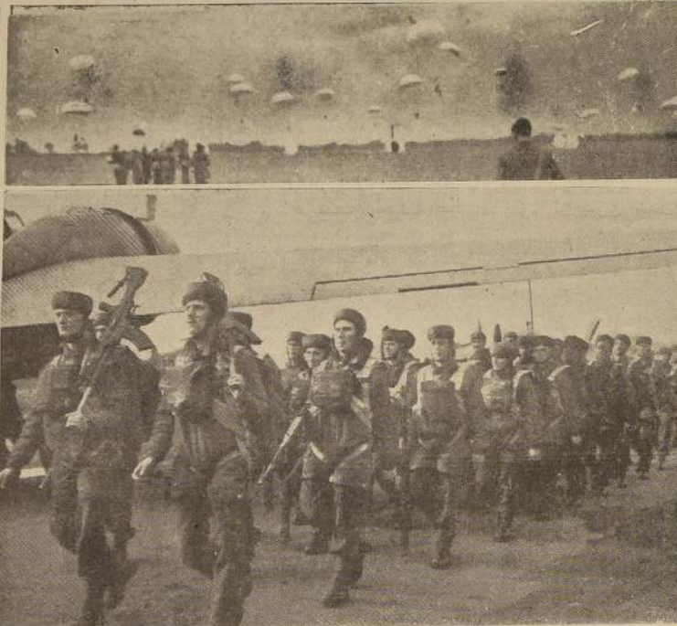
Paracaidistas ingleses encaminándose a sus aviones y deslizadores. Arriba, en pleno descenso

Aviones y deslizador cubrían el cielo. — Más de mil hombres bajaban en cada oleada de aviones