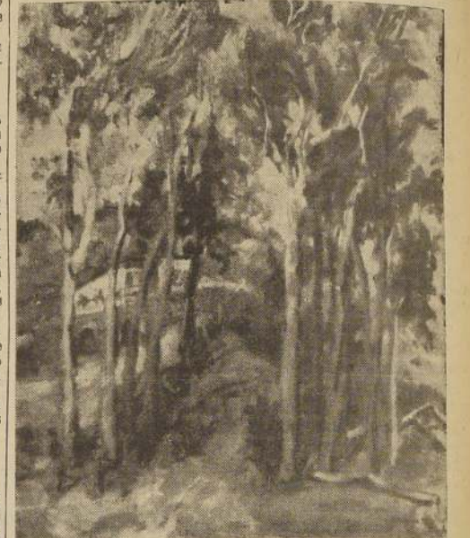
Uno de los cuadros que figuran en la exposición