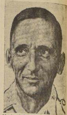
Mariscal del Aire, Arthur Tedder

Anunció también que en el ataque, efectuado el sábado, el "Hamm" se perdieron 18 bombarderos y 13 cazas.