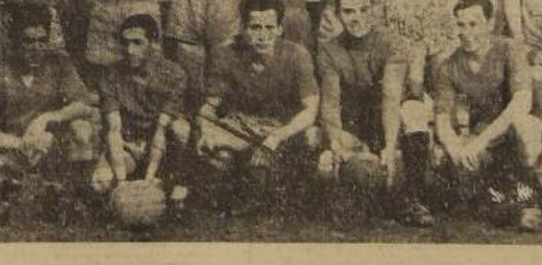
FOOTBALL DE PROVINCIAS. — Equipo que representó a Coquimbo en el encuentro que perdió con Colo Colo por dos goles contra uno. En el fondo los nortinos ausentes.