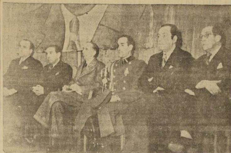
Durante el acto de ayer en el Teatro Cervantes.